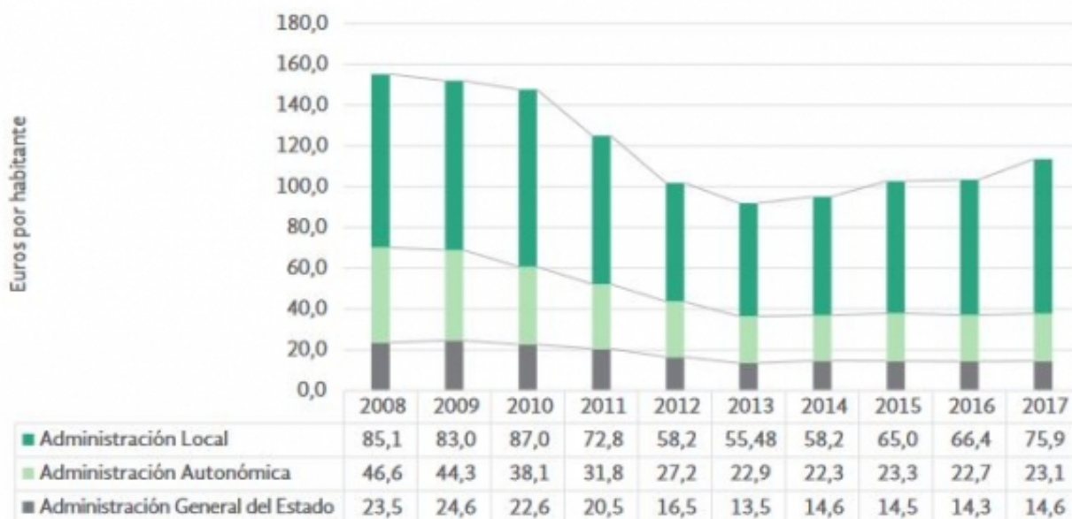
Gráfico 2. DATOS SOBRE EVOLUCIÓN DEL GASTO PÚBLICO EN CULTURA, EUROS/HABITANTE POR NIVELES DE ADMINISTRACIÓN, 2008-2017

Fuente: Estadística de Financiación y Gasto Público en Cultura.