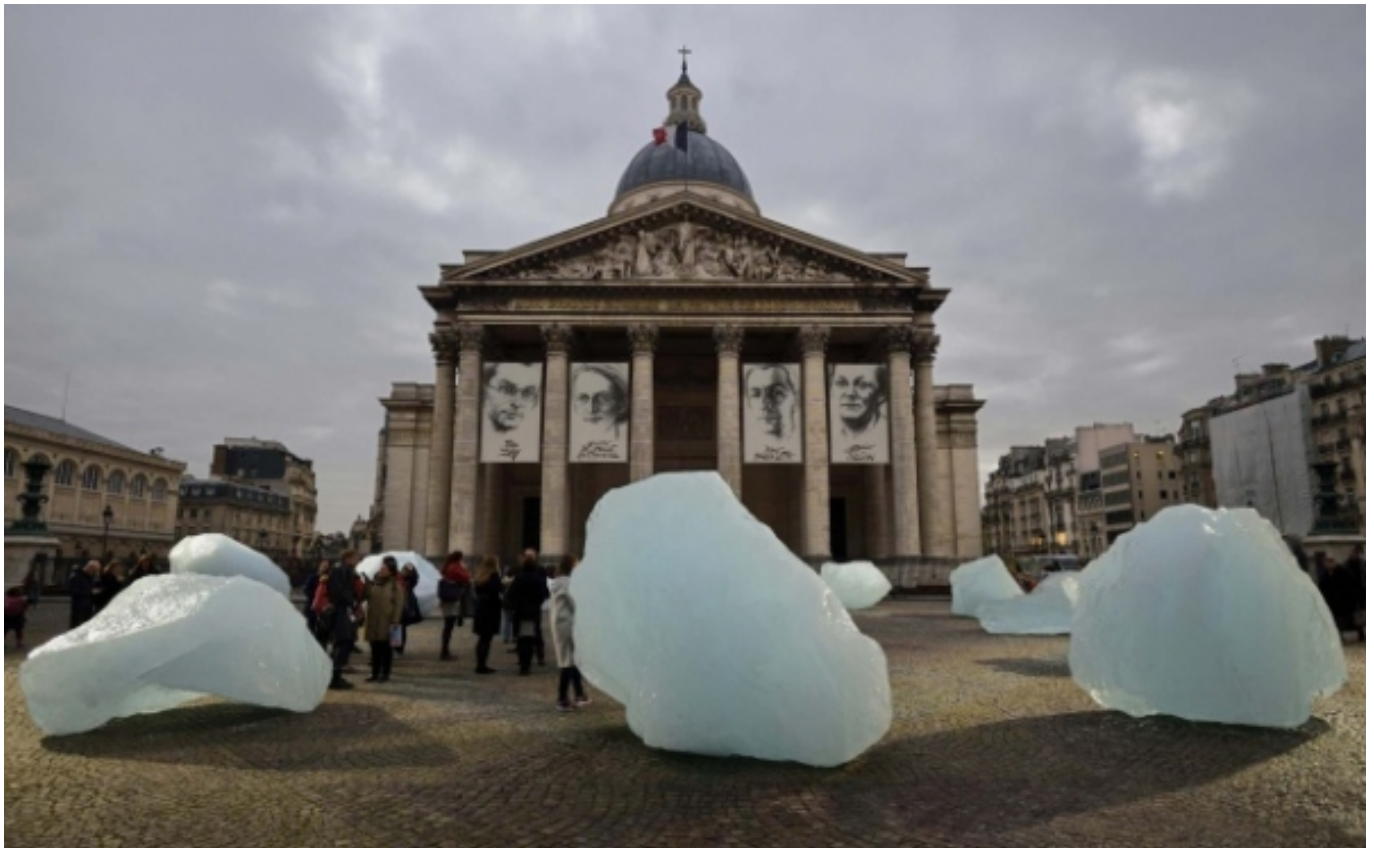
Ice Watch (2018)