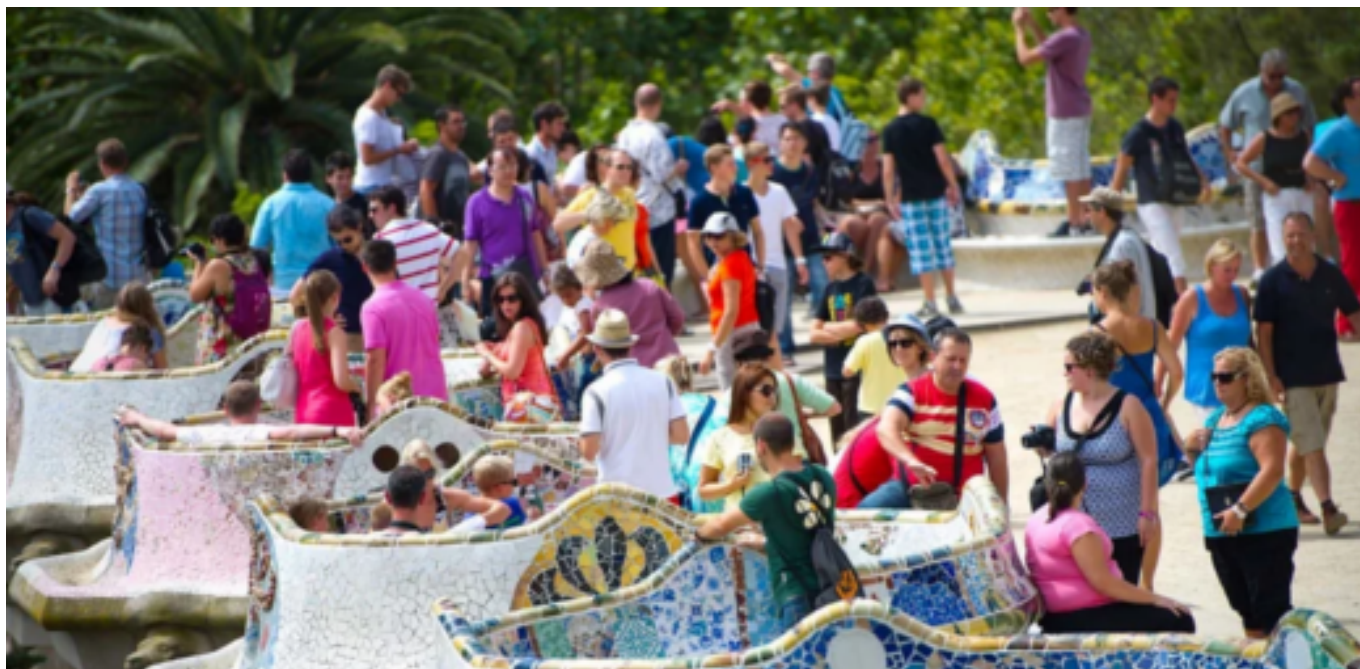
Turistes al Parc Güell.

parc d'atraccions i n'expulsa els residents. La tensió latent entre el global i el local genera situacions grotesques, com ara uns turistes fotografiant-se amb la pintada [13] 'Tourists go home'.