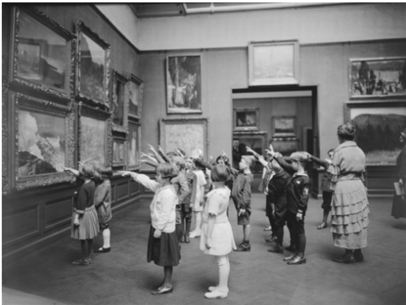
Visita educativa al Metropolitan Museum of Art [9] (1924)