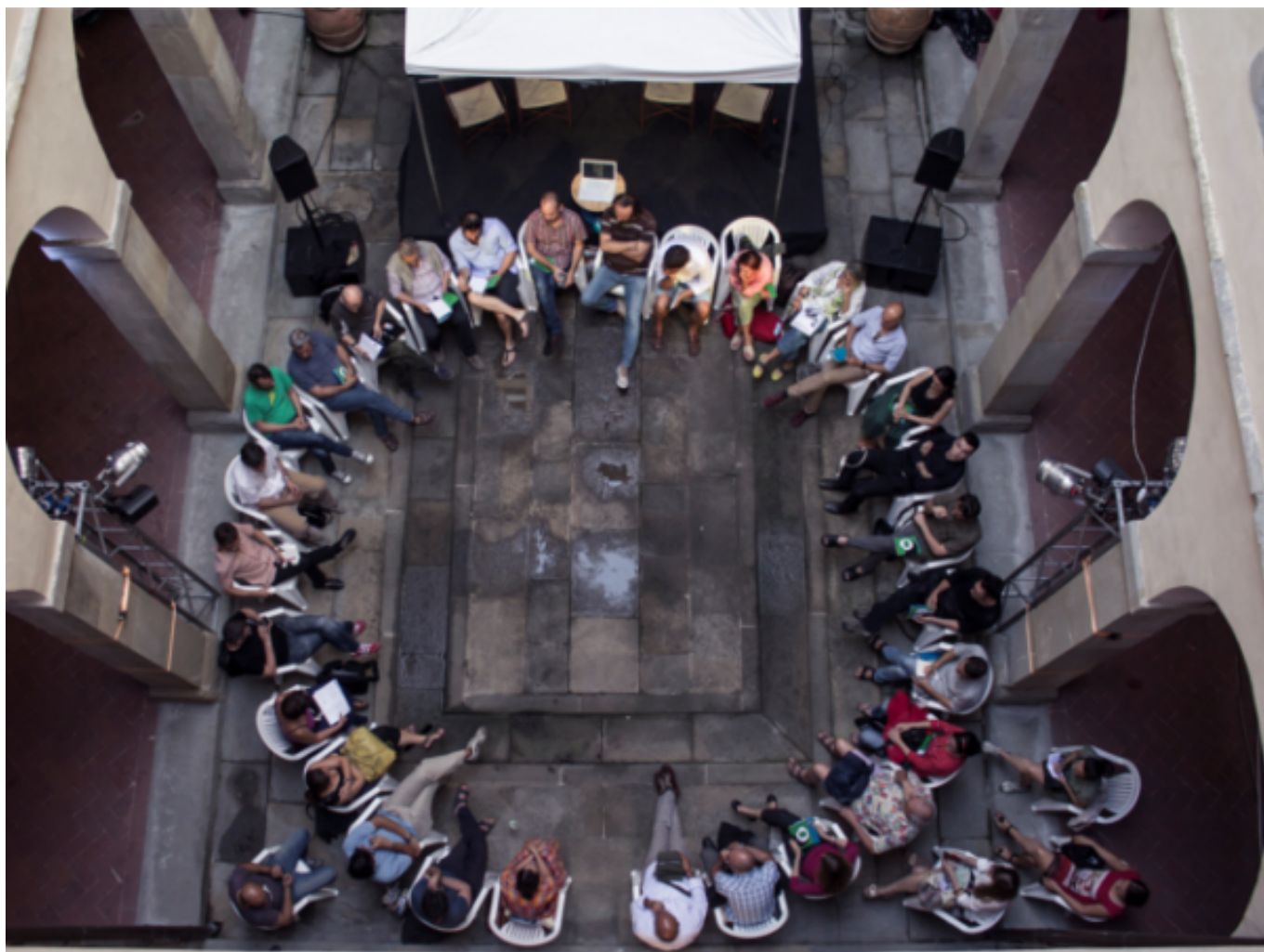
Una de les experiències del BeSpectACTive!, el Festival Kilowatt [8] de Sansepolcro (Itàlia). Imatge: scenecontemporanee.it [9]

Ara bé, aquesta participació no s'entén d'una única manera ni té una aplicació unitària. De fet, cal observar-la des de la interacció dels quatre paradigmes de les polítiques culturals. Bonet i Négrier tracen una cronologia esquemàtica de quatre paradigmes de les polítiques culturals. Cadascun dels paradigmes és una resposta a les necessitats d'un període històric concret. Des del seu punt de vista, la peculiaritat d'aquest àmbit és que els models no se substitueixen els uns als altres sinó que se superposen . La figura següent ho plasma: