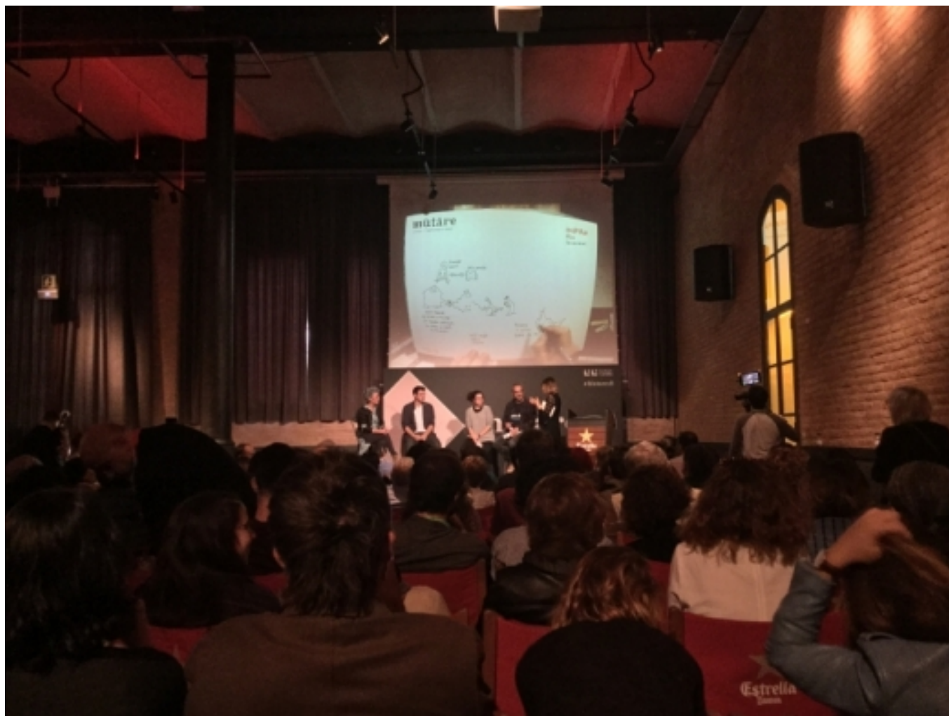
La sala de màquines estava plena de gom a gom.