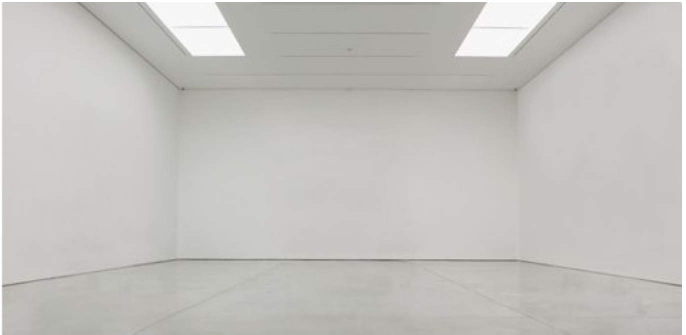
Un exemple de white cube. [11].

Més enllà de l'art per l'art, els mediadors són claus en l'activitat artística. Citant Bruno Latour [12], Fontdevila defineix els mediadors com aquells "actores dotados de la capacidad para traducir lo que transportan, de redefinirlo, de red desplegarlo, y también de traicionarlo", en oposició als intermediaris, que tan sols "transportan un significado o una fuerza sin introducir transformación alguna: definir sus datos de entrada basta para definir los de salida" (p. 36-37). Qui són aquests mediadors? A grans trets, són les institucions i els organismes que s'encarreguen de difondre i acollir l'activitat artística.