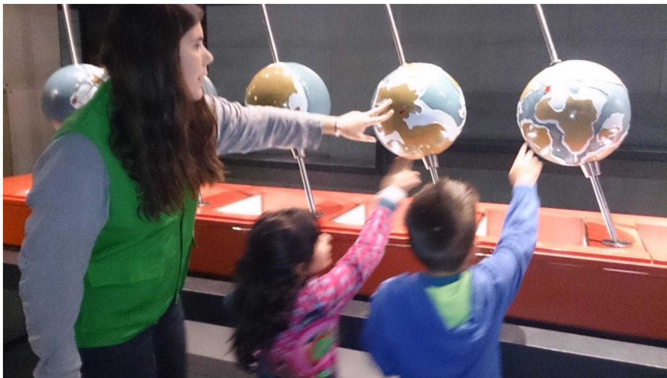
Una “explainer” en acció al Cosmocaixa

‘ Explainers [6]’ és un programa d’aprenentatge per formar adolescents com a guies de museu. Es tracta d’una iniciativa del San Francisco Exploratorium Museum [7] que va començar el 1969 i que s’ha convertit en model per a museus i centres científics de tot el món. Els estudiants esdevenen la cara pública dels museus; es formen acadèmicament en ciències i aprenen habilitats comunicatives per transmetre els coneixements de manera amena per encarar el repte de respondre els dubtes del públic, alhora que tenen una primera experiència en l’àmbit laboral com a treballadors de la cultura i l’educació . Explainers ha estat adoptat per diversos museus europeus, i CosmoCaixa [8] de Barcelona també ha implementat aquest programa per mediar entre els continguts museogràfics i els visitants .