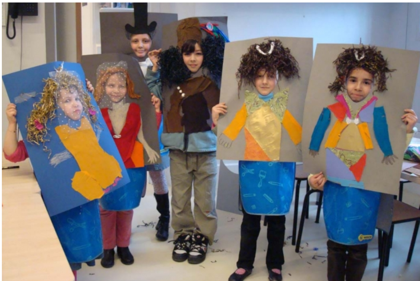
Els infants diuen la seva al Musée du petit palace a Avinyó

El projecte ' Au musée avec mes parents [11]' ('Al museu amb els meus pares') del Musée du Petit Palace [12] a Avinyó, és una iniciativa del servei educatiu que forma part d'un programa de cinc sessions destinat a fer que els infants de segon curs fins a secundària descobreixin el museu com a espai per al coneixement i la interacció social , junt amb les seves famílies. En les sessions 4 i 5, els infants escullen algunes obres amb les quals prèviament han experimentat i preparen una visita guiada per als seus pares; esdevenen agents actius per a la cultura i l'educació als museus, involucrant-se en un projecte que es fonamenta en la creativitat, la descoberta de les pròpies capacitats, el desenvolupament de les habilitats comunicatives i de mediació i la recerca d'una veu pròpia .