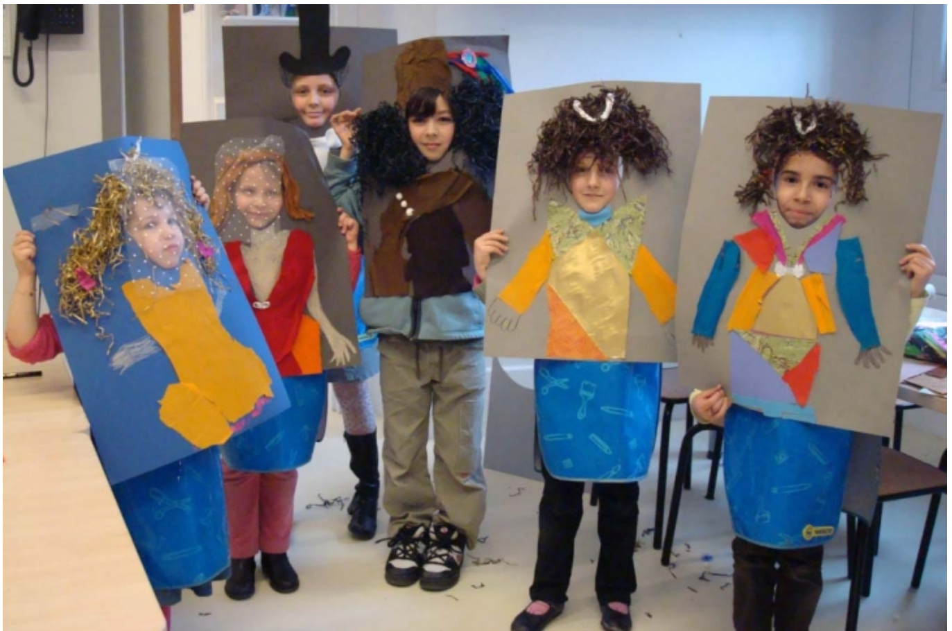
Els infants diuen la seva al Musée du petit palace a Avinyó

El projecte ' Au musée avec mes parents [11]' ('Al museu amb els meus pares') del Musée du Petit Palace [12] a Avinyó, és una iniciativa del servei educatiu que forma part d'un programa de cinc sessions destinat a fer que els infants de segon curs fins a secundària descobreixin el museu com a espai per al coneixement i la interacció social , junt amb les seves famílies. En les sessions 4 i 5, els infants escullen algunes obres amb les quals prèviament han experimentat i preparen una visita guiada per als seus pares; esdevenen agents actius per a la cultura i l'educació als museus, involucrant-se en un projecte que es fonamenta en la creativitat, la descoberta de les pròpies capacitats, el desenvolupament de les habilitats comunicatives i de mediació i la recerca d'una veu pròpia .