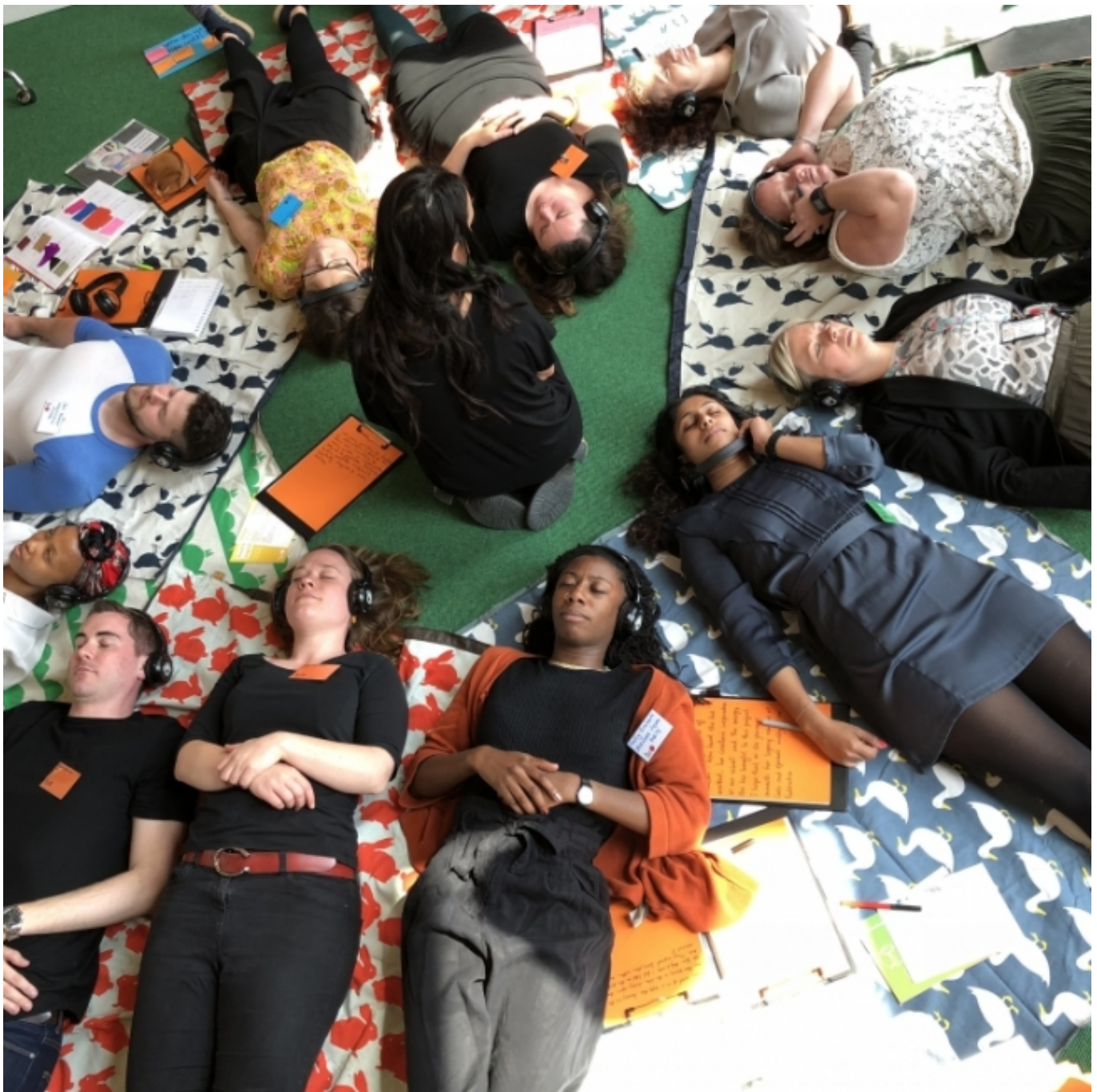
Imatge del web de la plataforma A New Direction [10]