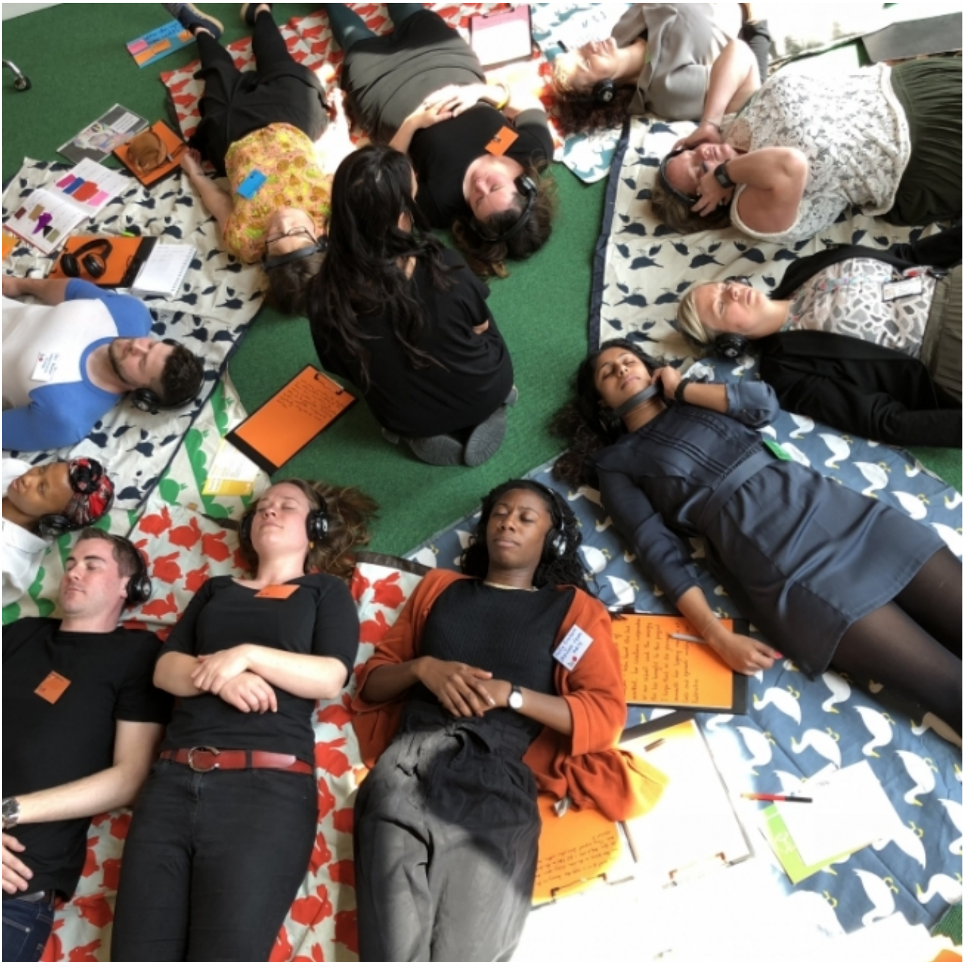
Imatge del web de la plataforma A New Direction [10]