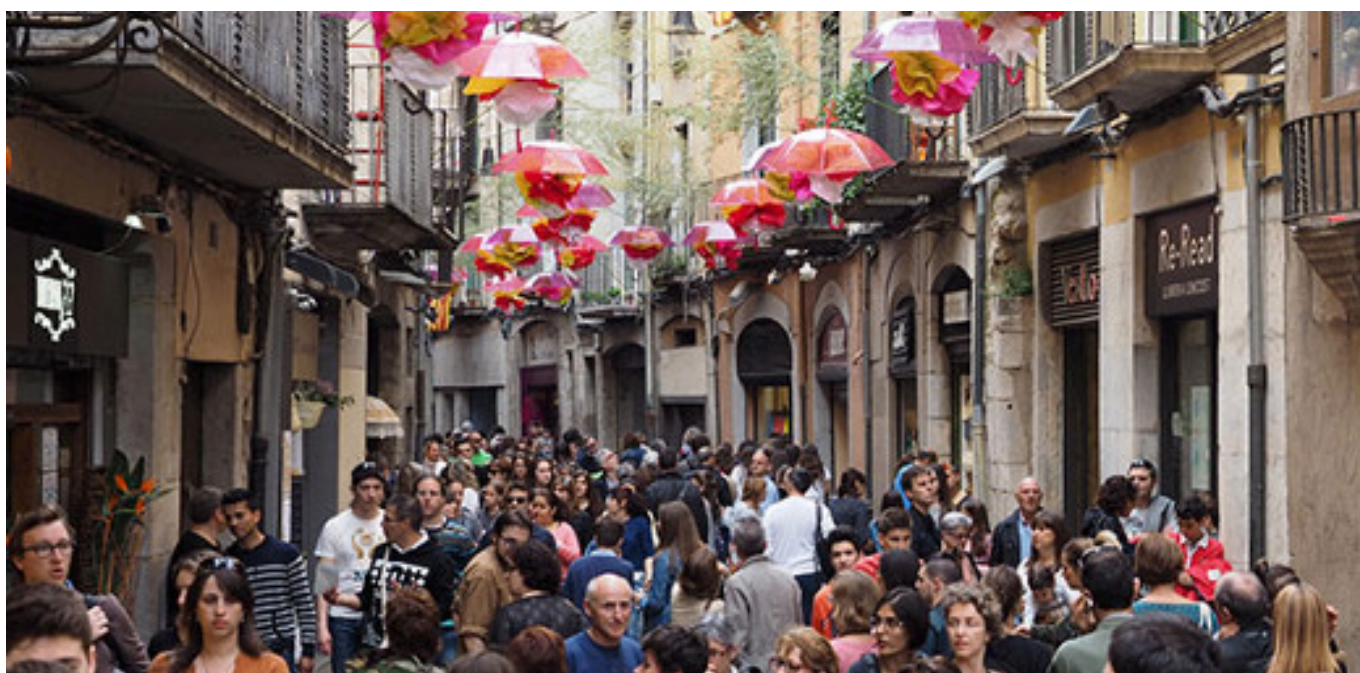
Carrer de Girona durant el Temps de Flors.

Certament, el model gironí es podria considerar un èxit . L'informe, obra de la consultora Bissap [6], destaca la bona valoració que els veïns i veïnes fan de les polítiques culturals del consistori. Així, un 77% dels enquestats les considera excel·lents . El perfil de ciutadà que participa en l'oferta cultural és una dona d'entre 38 i 50 anys que viu a Girona .