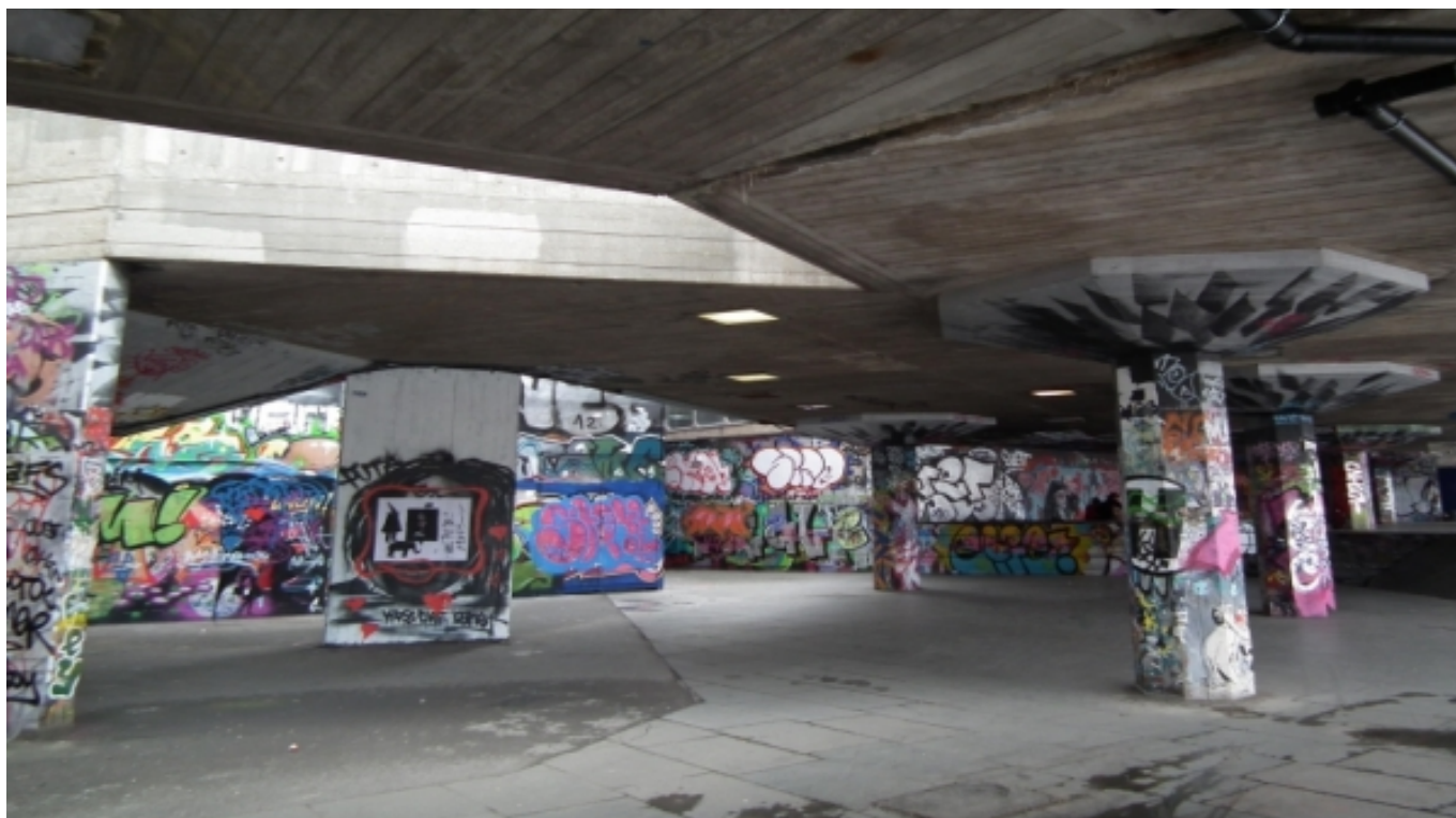
Zona de Southbank, a Londres

En la segona part , l'autor se centra en el ' rescat ' de la idea de creativitat, redibuixant una nova ciutat creativa a través de la història de l' intervencionisme urbà com a forma de resistència al desenvolupament dels plans urbanístics hegemònics, analitzant conceptes com el flaneurisme o el situacionisme de Guy Debord , i posant èmfasi al conflicte inherent entre cultura creativa suburbana i espai públic a través d'exemples d' escenaris subversius a la ciutat de Londres .