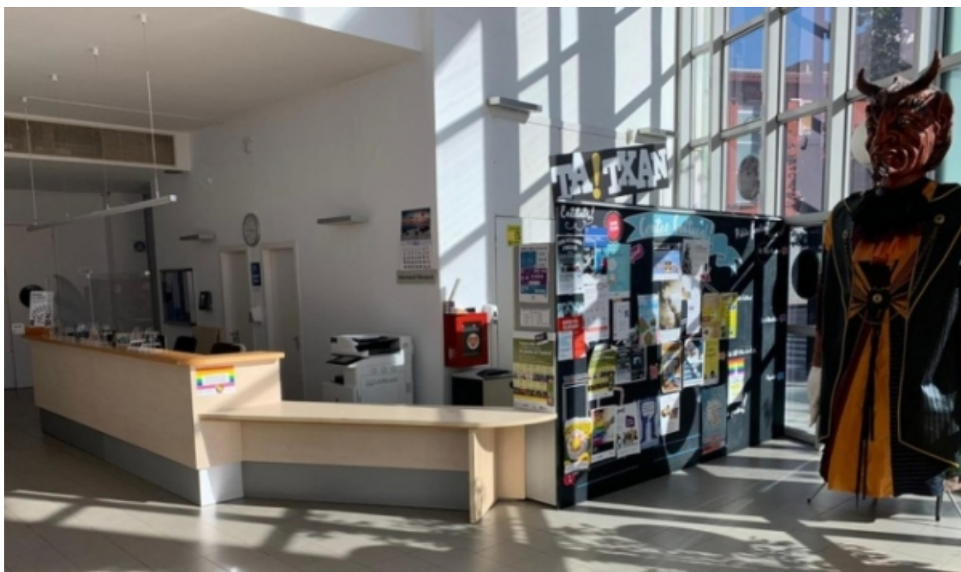
El Centre Cultural de Ripollet

Aquest canvi caldrà completar-lo amb normativa estatal i autonòmica que concreti els àmbits materials d'actuació municipal en aquesta matèria i tindrà un impacte rellevant ja que blindarà l'actuació municipal en la àmbit cultural al atorgar-li la categoria de competència pròpia.