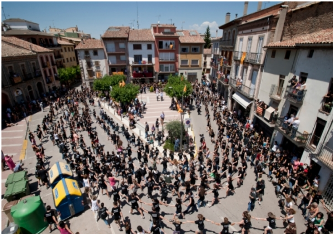
Festes en Prats de Lluçanès