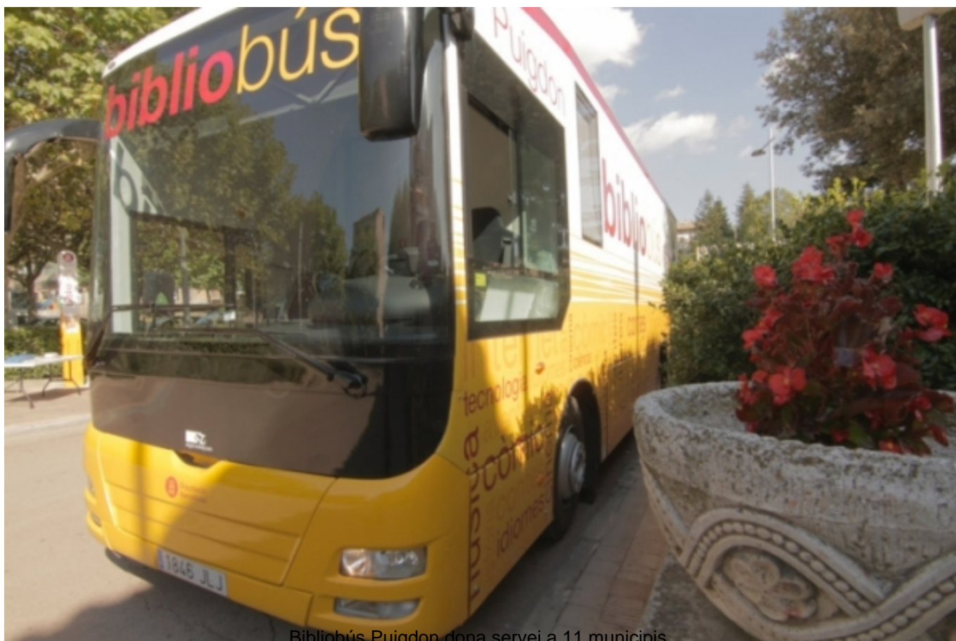
Bibliobús Puigdon dona servei a 11 municipis