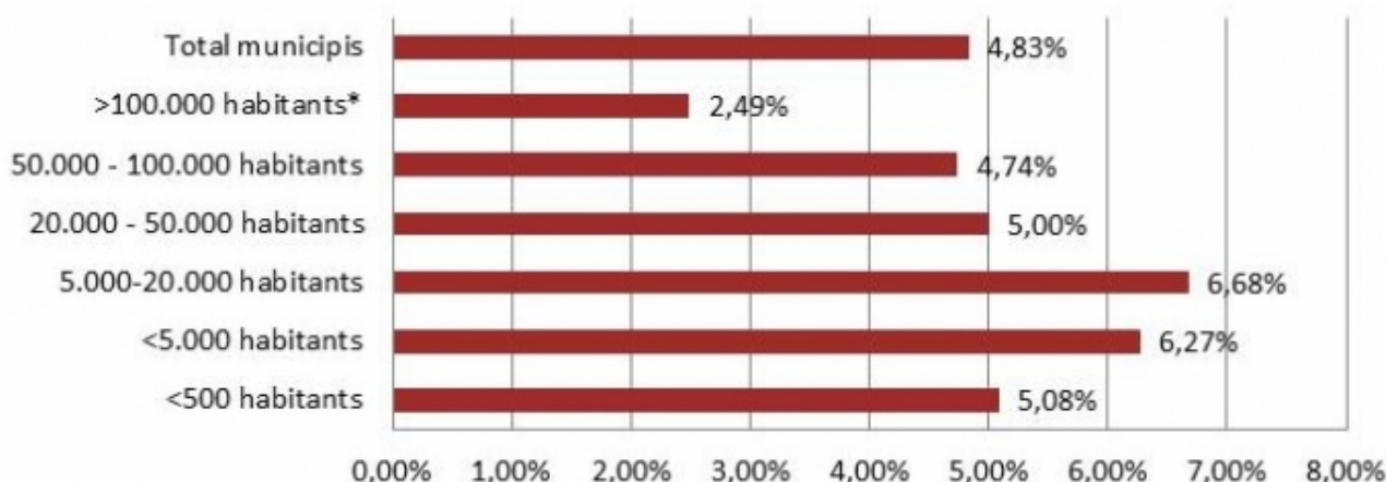
Gràfic 2: Esforç municipal en cultura per trams de població. % del pressupost dedicat a cultura. 2014

Si ens fixem en la despesa en cultura per habitant (taula 2), veiem com aquesta és també major, en els municipis petits i en els micropobles, que en la mitjana provincial. Les dades d'esforç en cultura dels municipis de menys de 5.000 habitants i dels micropobles l'any 2014 són significativament més altes que en els anys anteriors, i se situen per sobre dels seus nivells històrics, però les dades d'inversió per habitant són més normals, tot i que és rellevant que siguin les més altes.