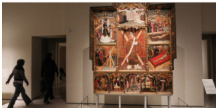
De Bernat Martorell a Coll