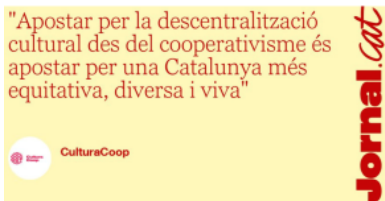
Sense descentralització no hi ha drets