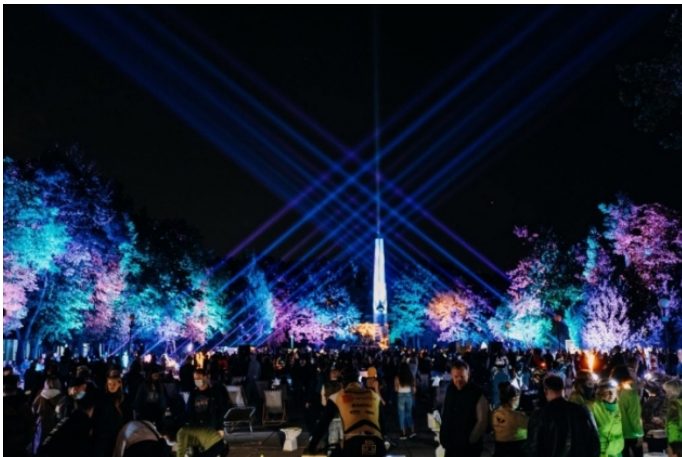
Celebració a la ciutat lituana de Kaunas, Capital Europea de la Cultura 2022 | kaunas2022.eu [4]

La publicació ofereix un glossari amb definicions clau que aproximen el lector a aspectes relacionats amb la planificació urbanística i territorial, la participació, el turisme i, és clar, el patrimoni i els megaesdeveniments. Aquesta carta pot servir també de guia per a la conceptualització i l'organització d'altres celebracions culturals, festivals i esdeveniments esportius que interactuïn amb el patrimoni material i immaterial de les ciutats.