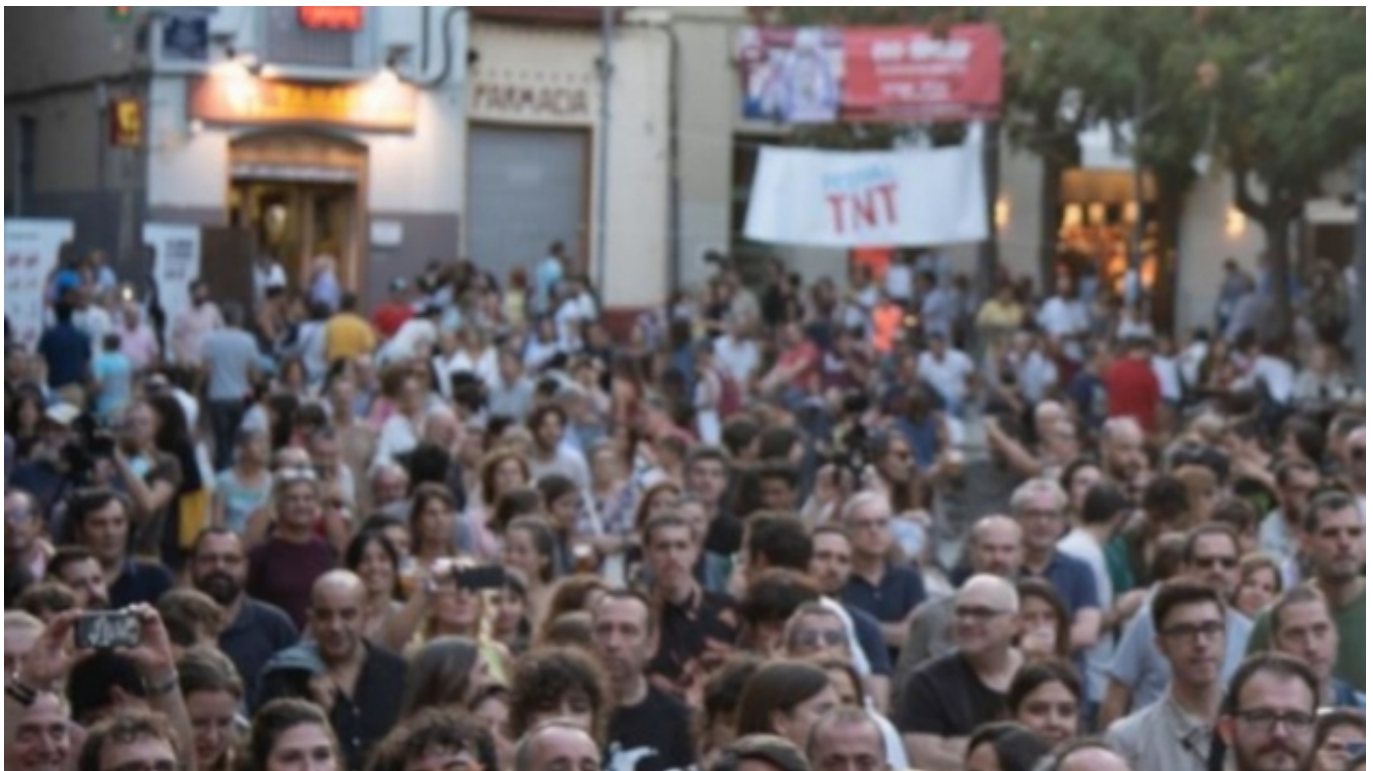
Festival TNT | tp.cat [3]

El primer bloc presenta com les avaluacions d'impacte social poden ajudar les organitzacions a potenciar estratègicament el seu impacte positiu i a reforçar la seva posició en la societat. A més, s'expliquen els conceptes d'impacte i avaluació i s'ofereix una descripció del concepte d'impacte social a partir de la literatura publicada en aquest àmbit.