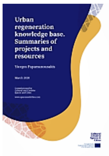
Papamanousakis, Y. (ed.). (2020).

Hi trobem anàlisis temàtiques per a cada iniciativa – amb un espai rellevant per a l'Agenda Urbana europea [5] o les experiències de diverses xarxes europees -, diversos casos d'estudi recolzats en literatura acadèmica i ofereix un resum crític comparatiu.