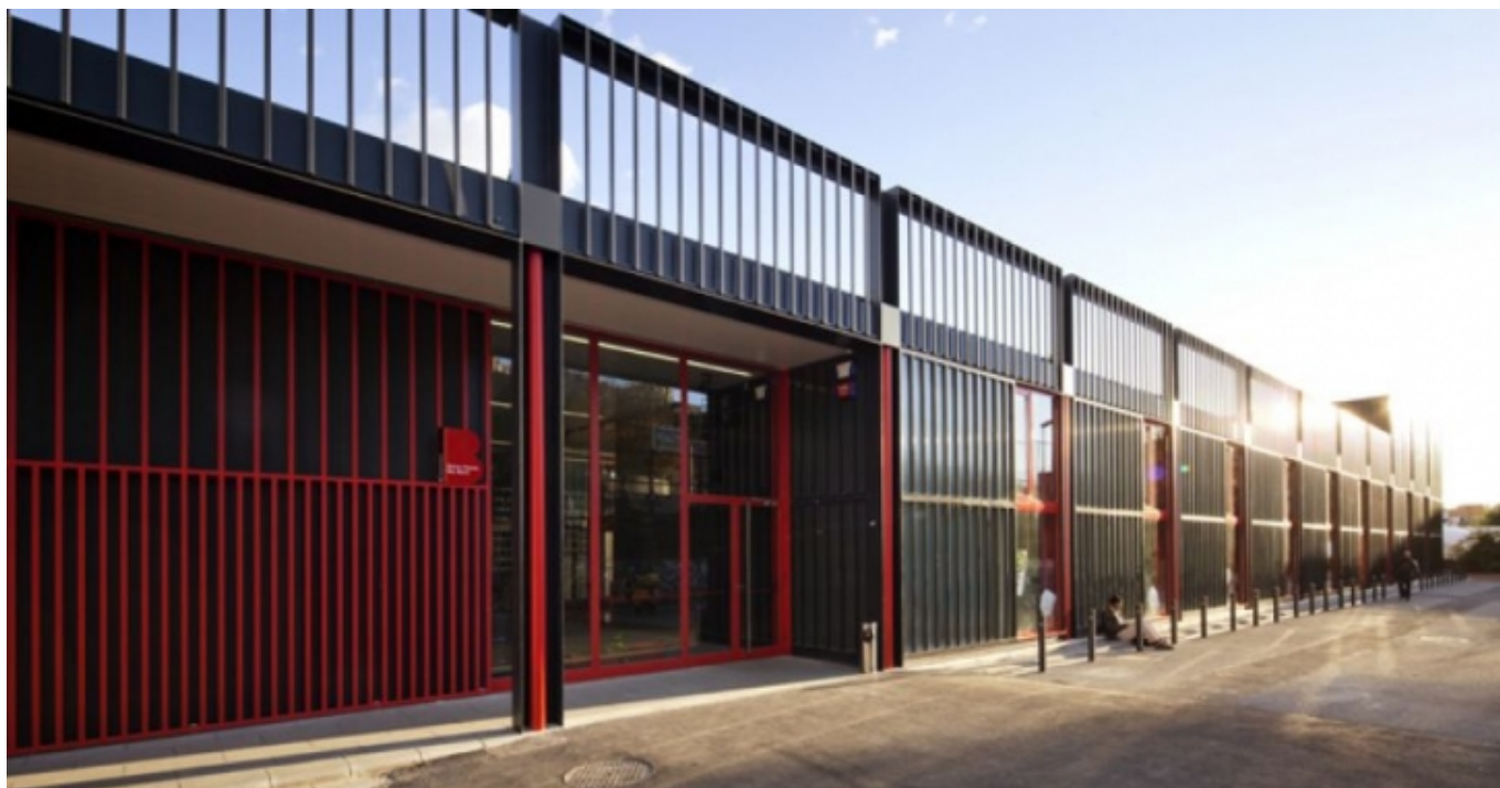
L' Ateneu Popular 9 Barris | ateneu9b.net