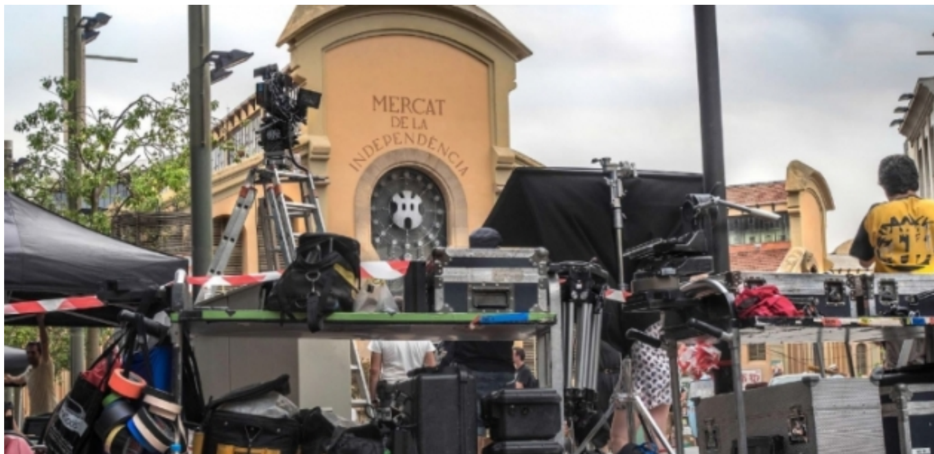
Terrassa, Ciutat Creativa del Cine.

Aquest programa de la UNESCO posa en contacte ciutats d'arreu del món amb la finalitat d' intercanviar experiències, idees i projectes pilot en l'àmbit de la cultura i l'art contemporanis i les indústries culturals, així com per fomentar la integració de la creativitat en la construcció de ciutats sostenibles i inclusives , en línia amb l'objectiu 11 (ODS11) de l'Agenda 2030 per al desenvolupament sostenible.