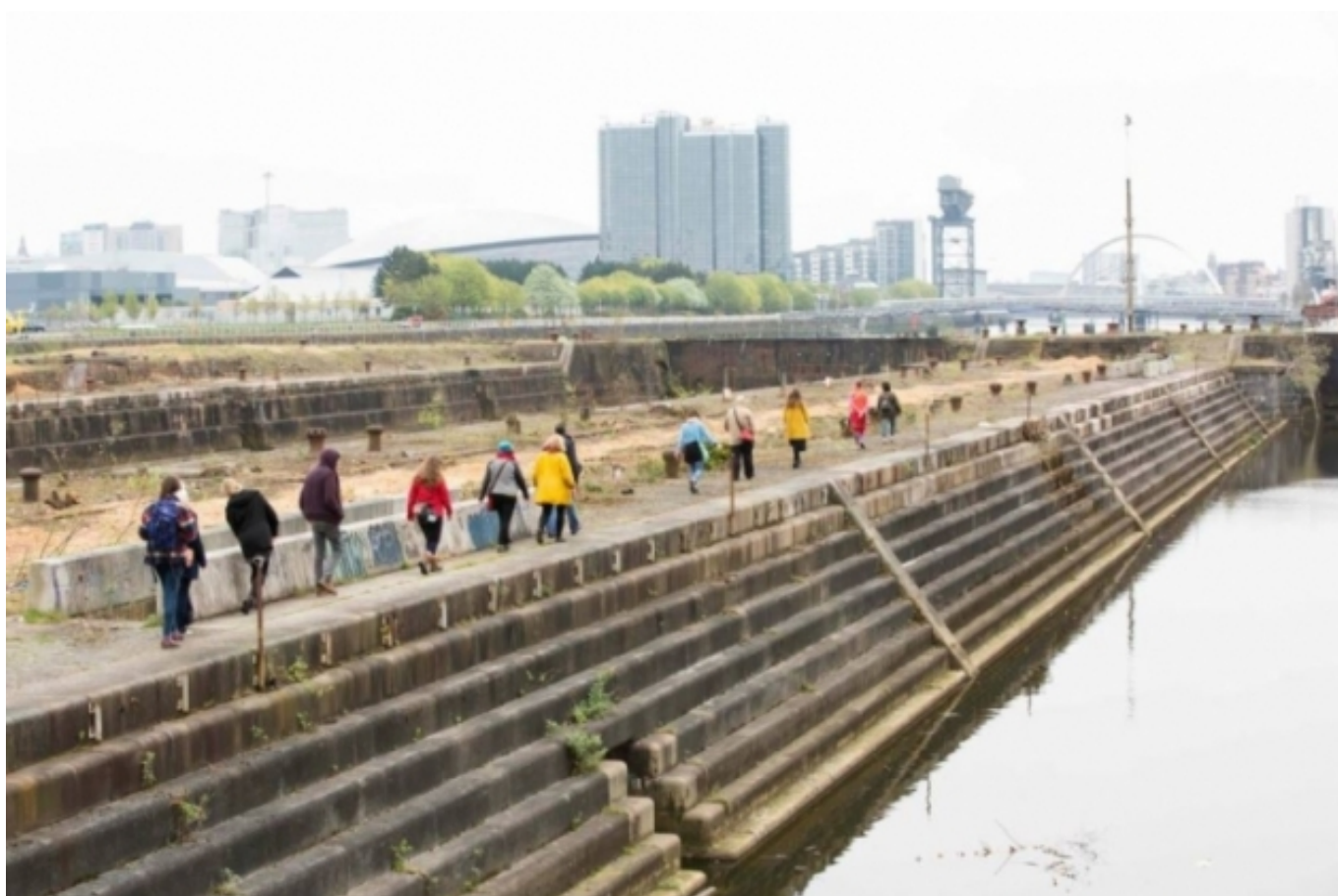
Activitat en el marc de la Green Art Lab Alliance. greenartlaballiance.com [6]

Pel que fa a les experiències recollides hi trobem el Food Art Film Festival [4] (FAFF), un festival que té l'objectiu d'enfortir els llaços entre les comunitats artístiques i els agricultors i productors locals, mitjançant tallers gastronòmics, conferències i un programa cinematogràfic especialitzat. Seguint amb l'èmfasi en el treball en xarxa i el coaprenentatge, la Green Art Lab Alliance [5] (gala) presenta una xarxa transnacional d'artistes i organitzacions artístiques creada per a compartir coneixements, experiències i recursos sobre sostenibilitat ecològica.