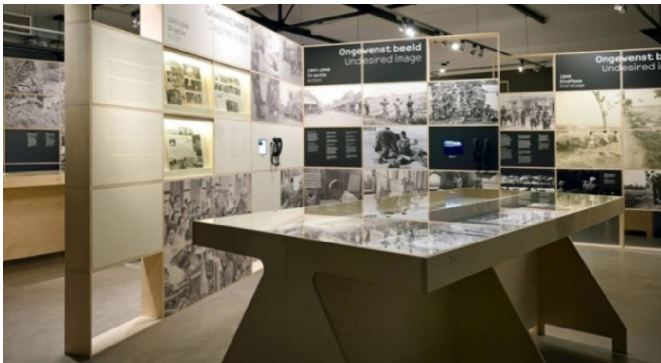
Museu de la Resistència d'Amsterdam | Verzetsmuseum

La resta d'aportacions analitzen aspectes com l'ús de les tecnologies als museus, el desenvolupament de públics a través de l'storytelling o, fins i tot, la concepció d'estratègies de planificació emocional.