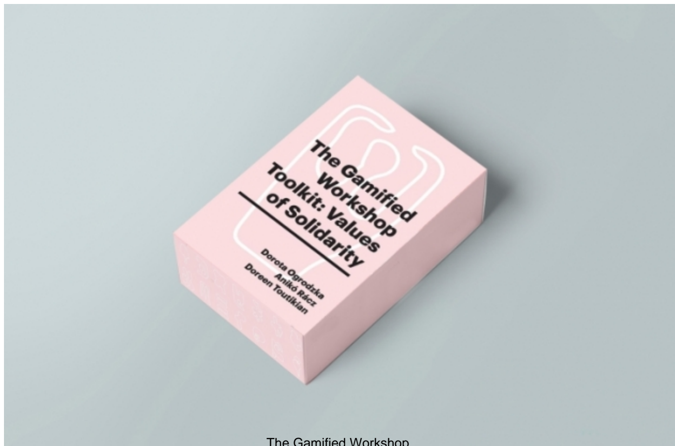
The Gamified Workshop