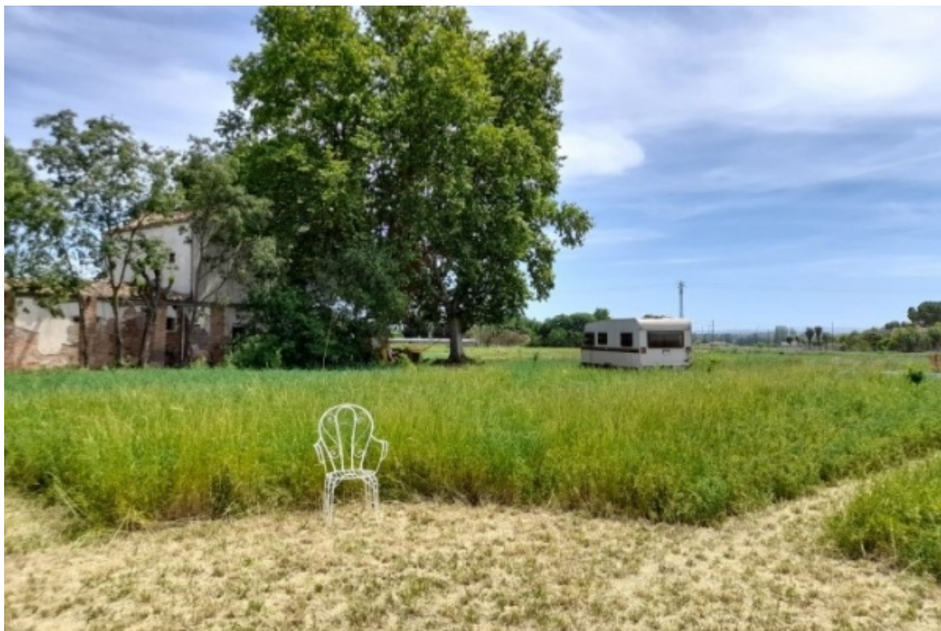
La Casa del Bosc', un espai que uneix cultura i natura a l'Horta de Lleida