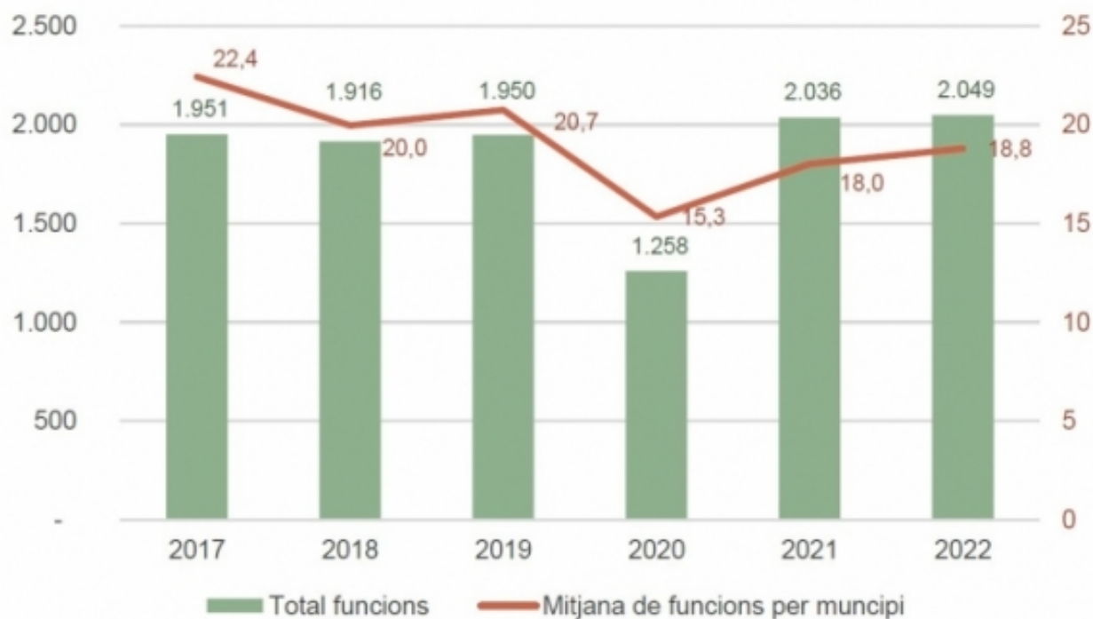
Funcions del Circuit. 2017 -2022

augmenta respecte l'any anterior, però es situa encara per sota dels valors assolits els anys precedents a la pandèmia.