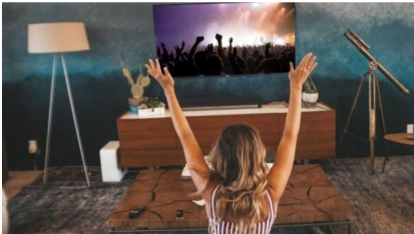
Imatge promocional de concerts en línia [7] a Buenos Aires

Amb el brot de la pandèmia, a més, la ràpida digitalització de continguts culturals va potenciar el "capitalisme de plataformes" privades (Guardiola, 2020), fet que va incrementar les desigualtats d'accés i agreujar la bretxa digital entre els col·lectius vulnerables. "La cultura digital no hauria d'estar lligada a les estructures tècniques, sinó a elements associats a l' horitzontalitat, la transparència, la participació i la porositat institucional . [...] Només ha de complir amb els preceptes d'immediatesa, no mediació i desjerarquització dels continguts" (Pivetta, 2021, p. 27). Des dels primers mesos de pandèmia es va advertir, en aquest sentit, que el gir digital s'ha convertit en pas endavant cap la privatització dels espais de la cultura : I què passa amb l'espai digital públic? Doncs que no existeix. Estem perdent l'espai públic a mesura que les nostres vides esdevenen cada cop més digitals. (Van der Waal et al., 2020, p. 11). Així, " l'expectativa democràtica " (Carnelli i Zuliani, 2020), " l'anelada redimensió de l'àmbit digital " (Acción Cultural Española, 2021), si no es fonamenta en els drets humans i culturals i el desenvolupament sostenible, pot representar un retrocés per a les polítiques culturals (Kulewska i Tomaszuk, 2020).