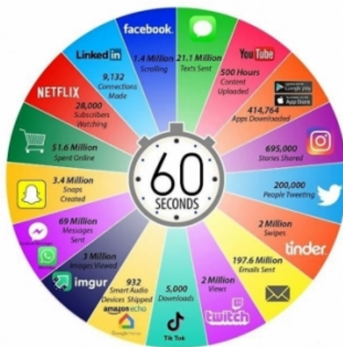
"2021: This Is What Happens in an Internet Minute".

Infografia creada per Lori Lewis [8], especialista en públics digitals