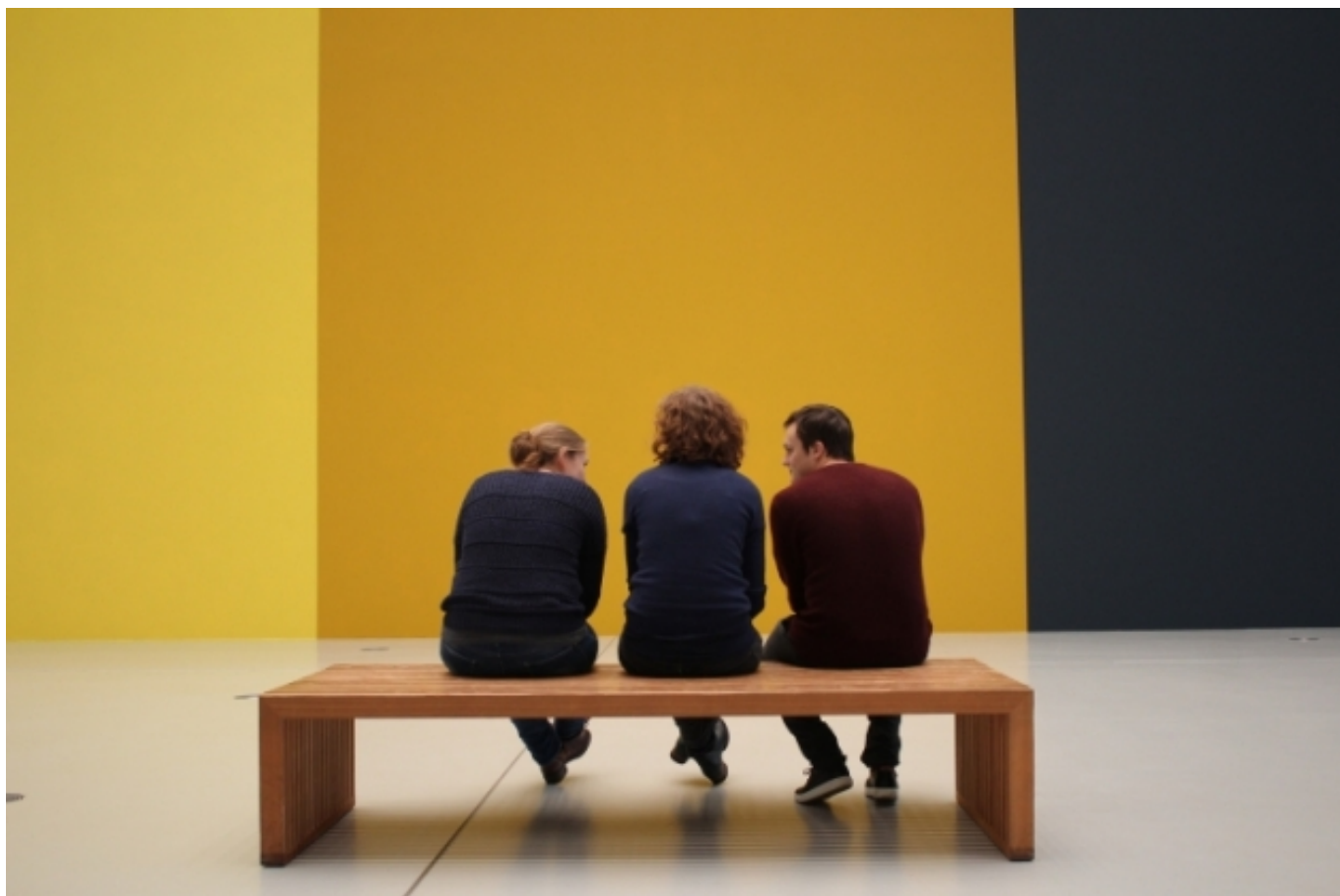
Visitants de museus