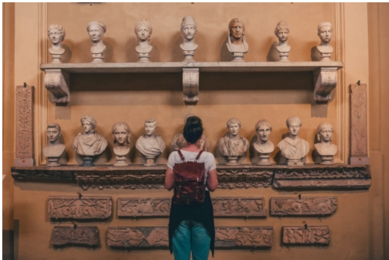
Museus Vaticans, Roma

Aquest article fa un recorregut per alguns dels estudis duts a terme durant els últims anys pel que fa al personal dels museus. Tot seguit, es presenten dos treballs que s'han publicat recentment a casa nostra i que, després d'anys de ser requerits pel sector, contribueixen a posar llum a la foscor. Paral·lelament, es fa esment de la posició que adopten ambdues publicacions envers a qüestions que, de forma inevitable, també entren en l'equació: l'externalització de serveis, els professionals dels museus més enllà dels perfils museològics, l'escassetat dels equips dels museus , etc.