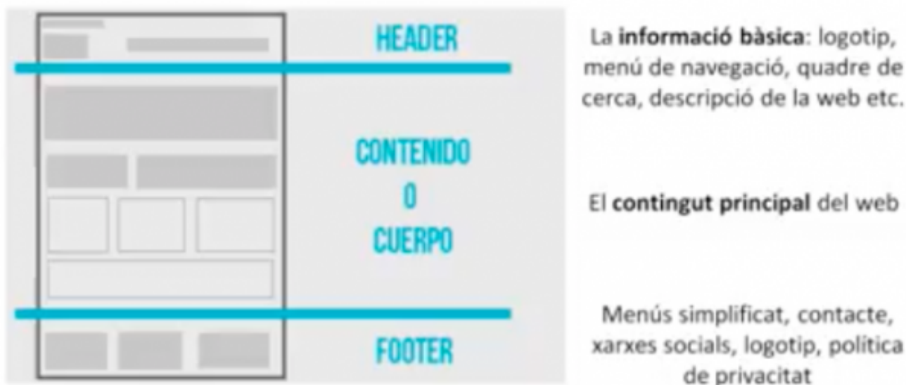
Imatge de la presentació de La Tremenda

L' e-mail màrqueting o butlletí electrònic, és una eina d'interacció amb l'usuari que permet una comunicació molt individual i personalitzada. Per a fer un bon butlletí electrònic cal tenir una bona base de dades, elaborar contingut rellevant i d'interès, crear un assumpte que actuï com a reclam, pensar un disseny que generi trànsit, així com planificar bé horaris i l'assiduitat de l'enviament. Algunes plataformes recomanades són Mailchimp [3] i Mailerlite [4]