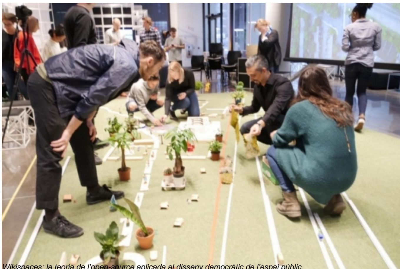
Wikispaces: la teoria de l'open-source aplicada al disseny democràtic de l'espai públic.