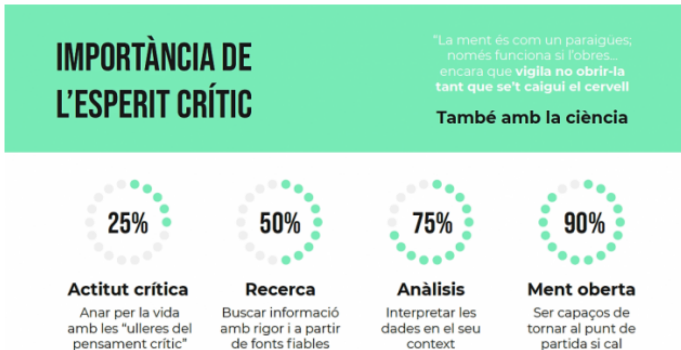
Imatge de la presentació de Valentina Raffio al curs

Per a Valentina Raffio desenvolupar l'esperit crític és la millor protecció contra les notícies falses.