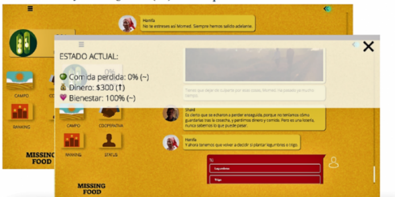
Exemple de ludificació aplicada a la divulgació científica

Catanzaro conclou que quan un s'acostuma a consumir productes informatius molt més elaborats, sol tenir un comportament bastant més reticent a les notícies falses . I tenim molts recursos al nostre abast per estar ben informats.