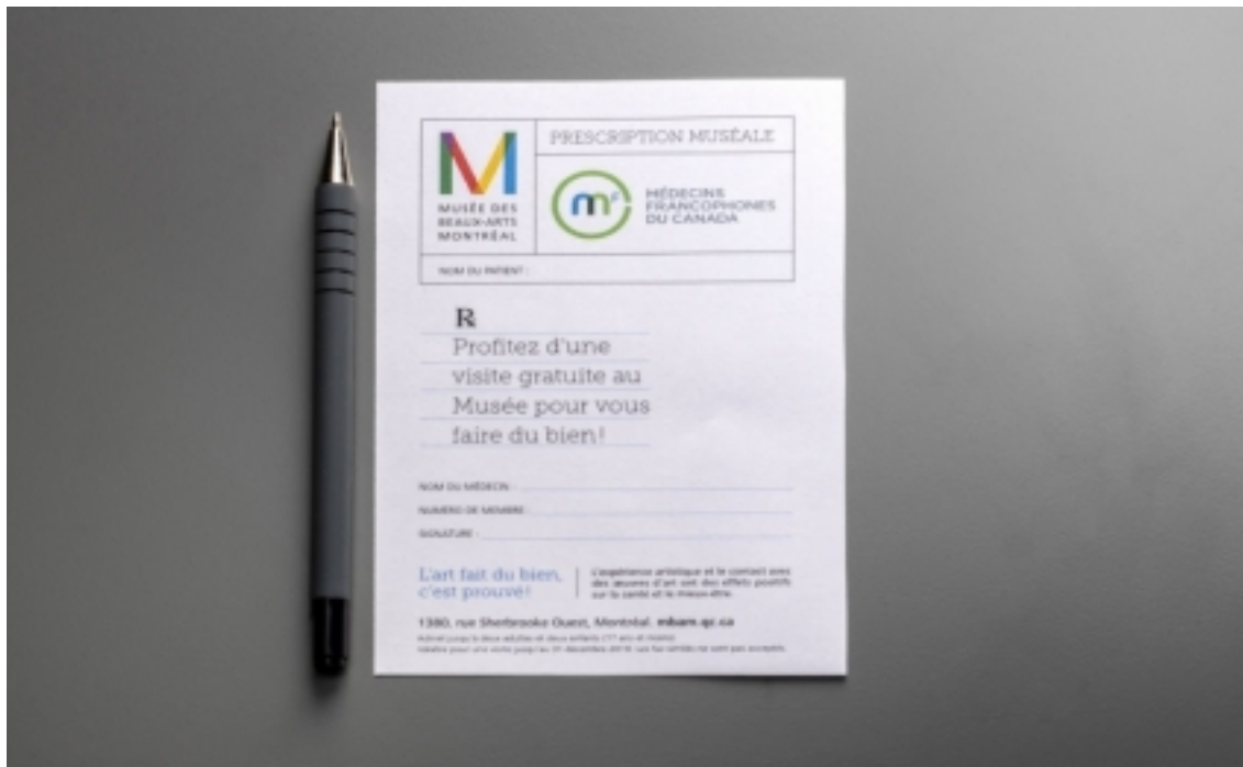
Prescription muséale MBAM-MFdc

Tot seguit, va ser el torn de la taula d'experiències, composta per 5 casos rellevants que posen de manifest l'important paper dels museus en el foment de la salut i el benestar: