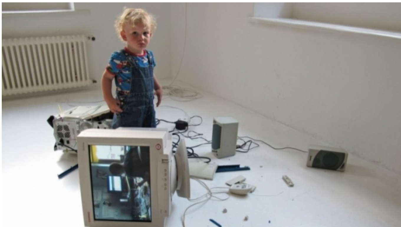
"My generation" (2010) Obra dels artistes Eva i Franco Mattes

En aquest punt ens referim a l'article La tecnología como inclusión educativa de la diversidad cultural [11][8] com a exemple il·lustratiu de l'anàlisi de l'ús de les anomenades autonarratives digitals com a eines pedagògiques de transformació social dissenyades per a afavorir un alumnat lingüísticament i culturalment divers. L'aprenentatge actiu és una de les oportunitats que ens brinda la revolució 4.0, i el projecte extraescolar 'La Clase Mágica' fa possible la connexió entre alumnes de diversos contextos culturals i lingüístics, i també fa que aquests alumnes esdevinguin professors d'ells mateixos i els seus companys. Està dirigit a estudiants hispans bilingües d'un centre de Texas, i fa ús de dispositius com les tauletes, els telèfons mòbils i els jocs en línia per mostrar les potencialitats de la Xarxa pel que fa a la construcció de coneixement, llenguatges, identitat, respecte i confiança. 'La Clase Mágica', amb tot, és un projecte que ve de lluny. Es tracta d'un model basat en el constructivisme social que es va originar fa anys per afavorir la inclusió de minories (en concret, la integració d'infants migrants llatins a la cultura nord-americana), i que s'ha implantat en entorns molt diversos arreu del món.