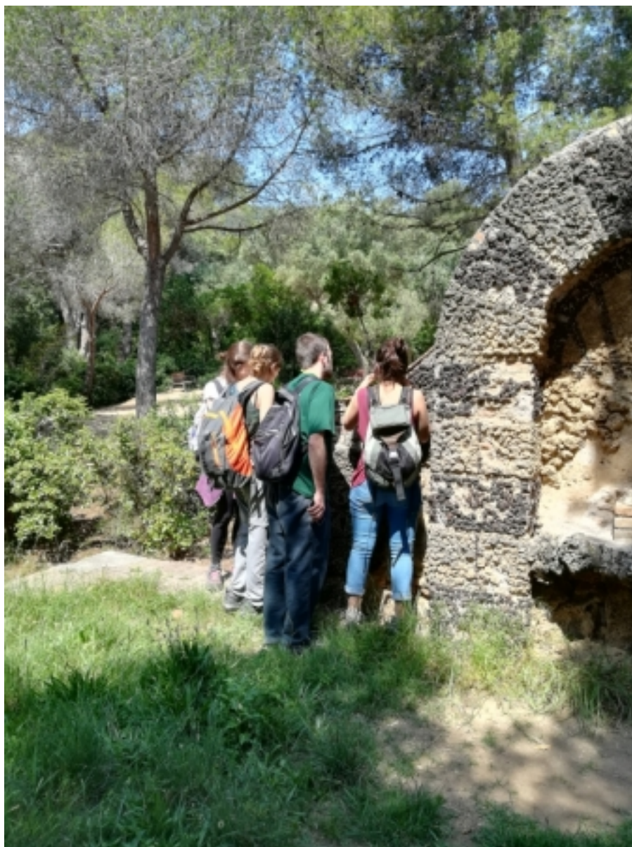
Bioblitz al Parc de l'Oreneta (Sarrià). Una activitat de ciència ciutadana per descobrir el patrimoni natural de la ciutat, per una iniciativa "bottom-up"

Una mostra de creació de xarxa top-down i amb un resultat positiu va tenir lloc a Sarrià-Sant Gervasi. Fa uns anys es va aprofitar que en el Districte de Sarrià-Sant Gervasi, a Barcelona, tenen la seu moltes entitats dedicades al coneixement i es van organitzar esmorzars per potenciar sinèrgies especialment en l'àrea de salut i educació. Entre diverses entitats, escoles, centres de recerca (IQS, La Salle, URL) es va pensar a fer una experiència pilot per estimular les vocacions científiques de forma col·laborativa.