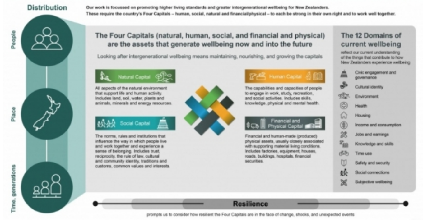
Representació del marc de qualitat de vida, dissenyat per la hisenda neozelandesa

The Treasury's Living Standards Framework (Dalziel et al., 2019a, p. 82)