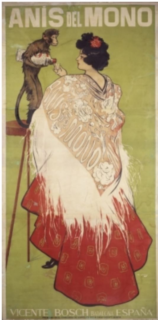
2) Anís del Mono (Con una falda de percal planchá), Ramon Casas