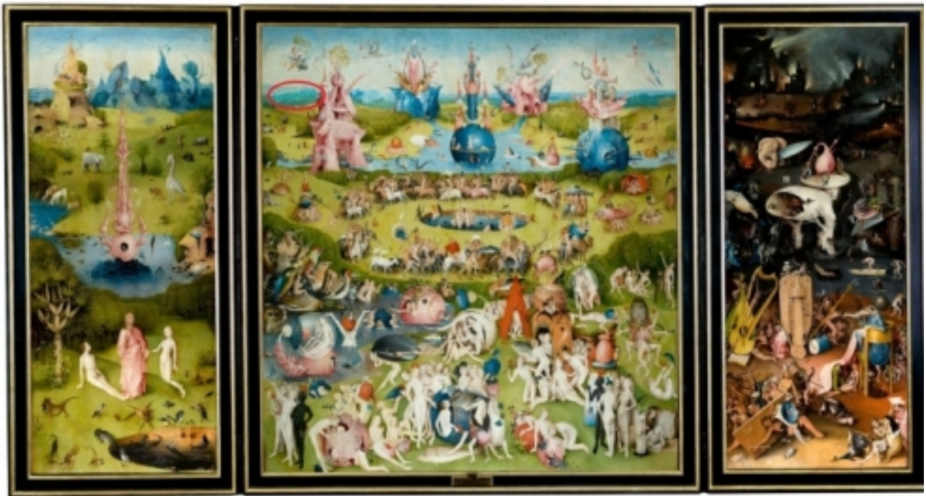
El Jardí de les Delícies, El Bosco