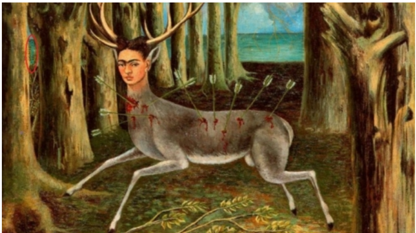
El venado herido, Frida Kahlo