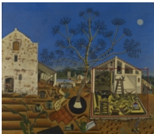
4) La Masia, Joan Miró