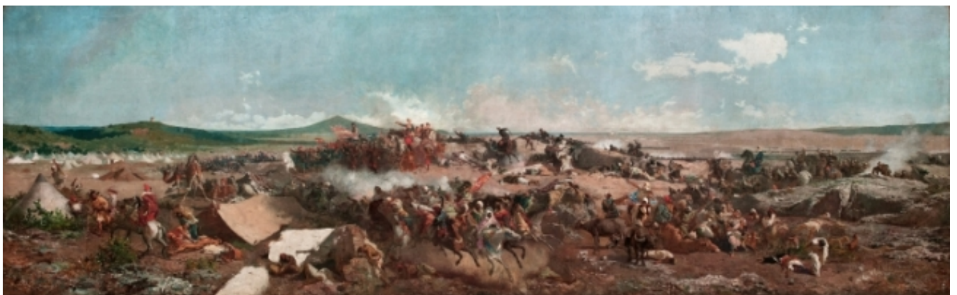
3) Batalla de Tetuan, Marià Fortuny