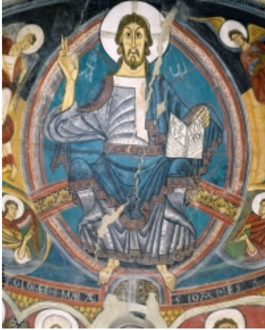
1) Pantocràtor de Taüll