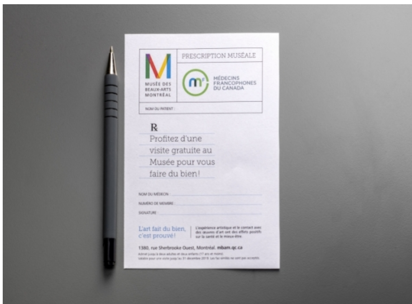
Prescription muséale MBAM-MFdC

El ponent assegurava que aquesta iniciativa ha permès constatar el que, per part de molts professionals sanitaris, s'havia rebut en un principi amb molta reticència malgrat les evidències científiques existents: l'art aporta beneficis en el benestar de les persones . En aquesta línia, Bastien va compartir amb tots els assistents una bona notícia, i és que, gràcies als bons resultats fins a data d'avui, s'ha aconseguit la col·laboració amb altres institucions culturals i amb el propi govern del Quebec .