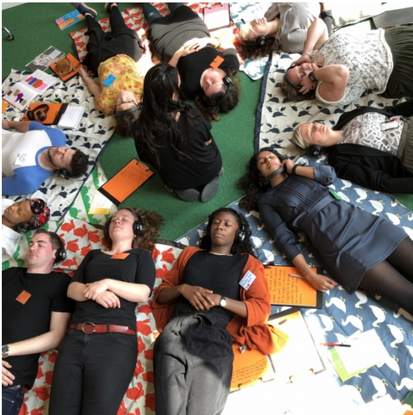
Imatge del web de la plataforma A New Direction [10]