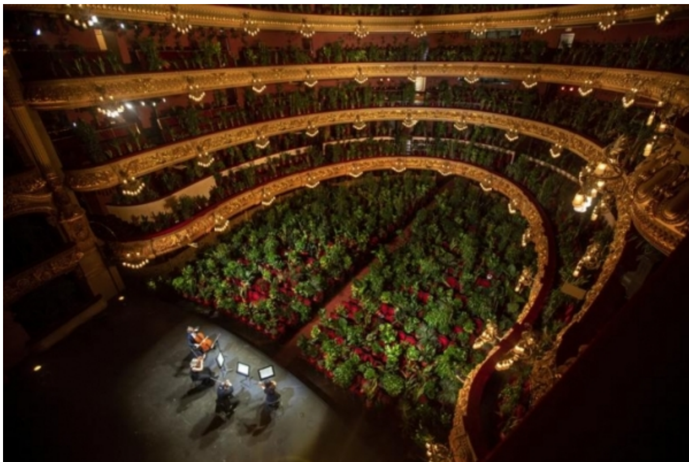
Concert pel Biocè [7] al Gran Teatre del Liceu