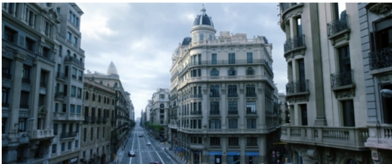
La Via Laietana a 'Los últimos días' (2013)

Un dels escenaris més sorprenents ha sigut trobar-se els patis de cadires sense passadissos, allunyades a dos metres les unes de les altres. De la mateixa manera que hem vist platees amb cintes d'obra, plenes de plantes o fins i tot amb maniquins [5] o Minions... que poc ens arribàvem a pensar com viuríem la música [6] i les arts escèniques!