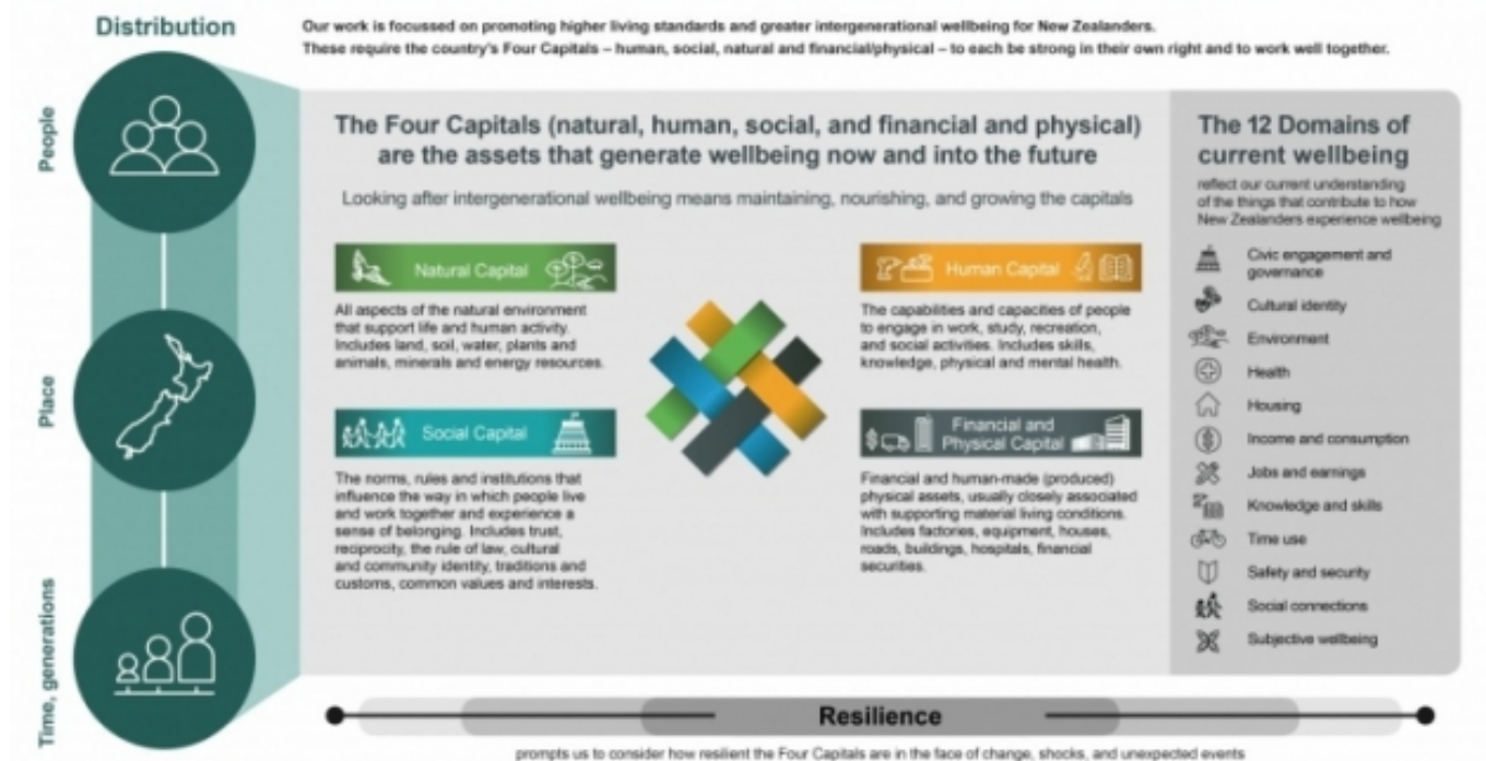
Representació del marc de qualitat de vida, dissenyat per la hisenda neozelandesa

The Treasury's Living Standards Framework (Dalziel et al., 2019a, p. 82)