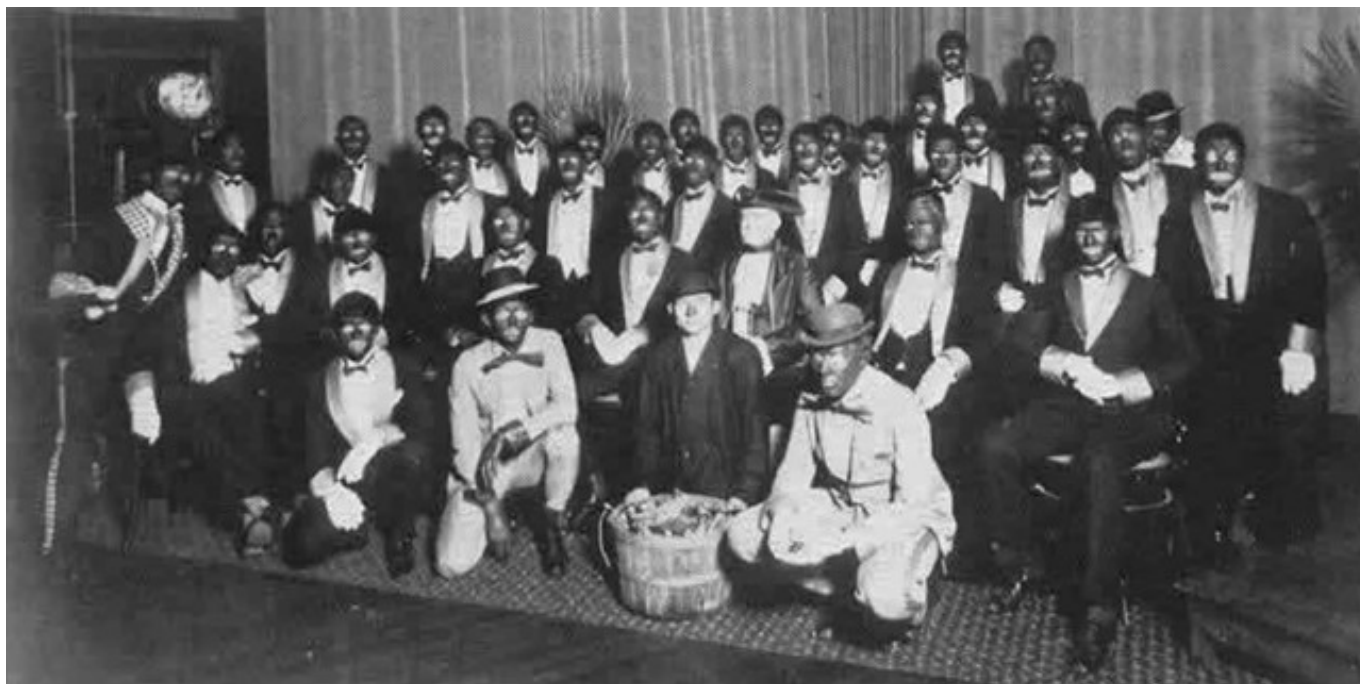
El repartiment d'un minstrel show , tots amb la cara pintada de negre. Imatge: History on the Net [9]

Shakespeare avait dû être bien connu dans l'ensemble de la société, puisque les gens ne peuvent parodier que ce qui leur est familier" (p. 17).