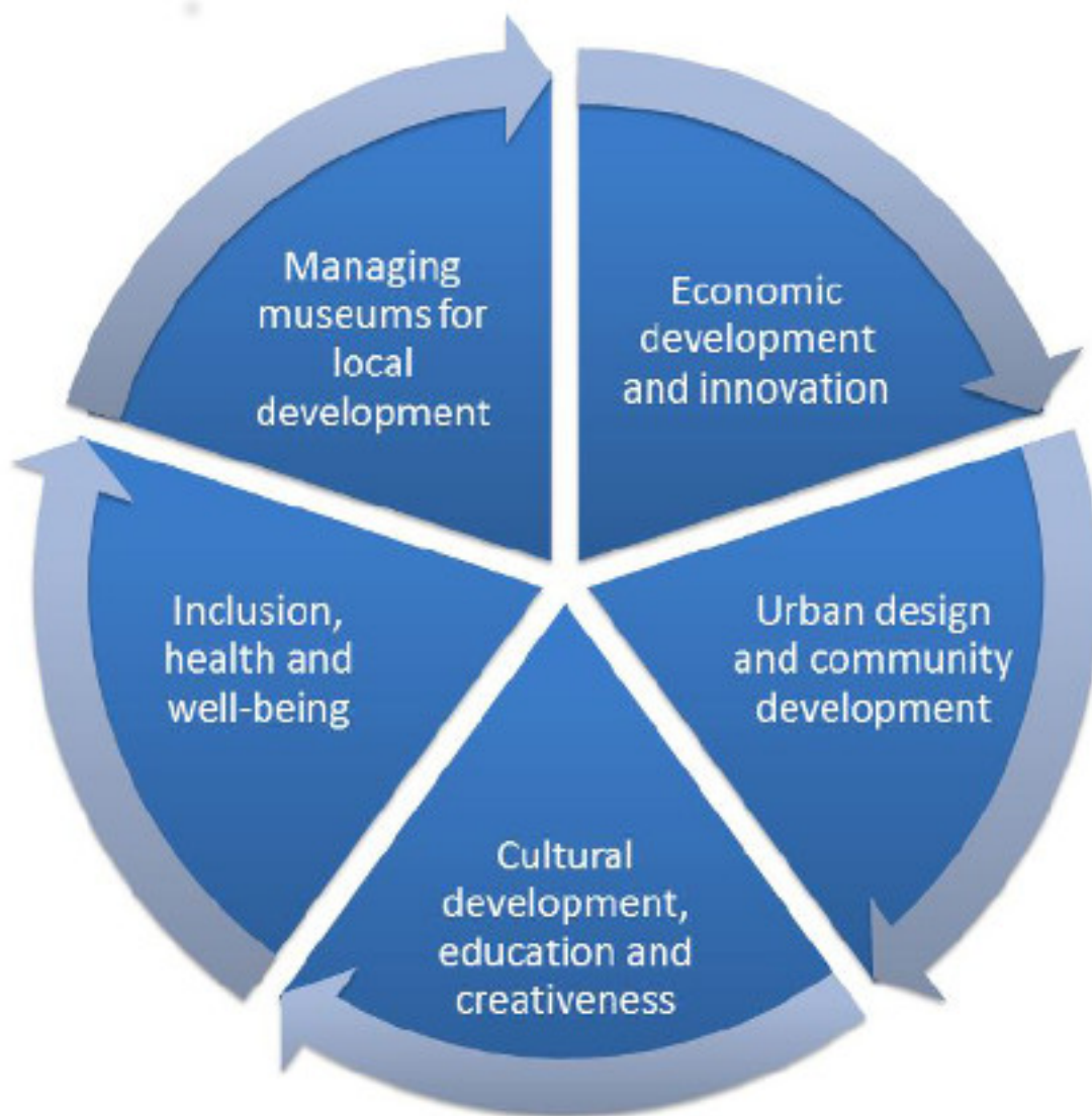
Figure 2.1. The structure of the guide

A l'inici de cada apartat es resumeixen les propostes claus que poden dur a terme els ajuntaments i les institucions. Per exemple, en el capítol "Managing the relationship between local government and museums to maximise the impact on local development" es mostra aquesta taula: