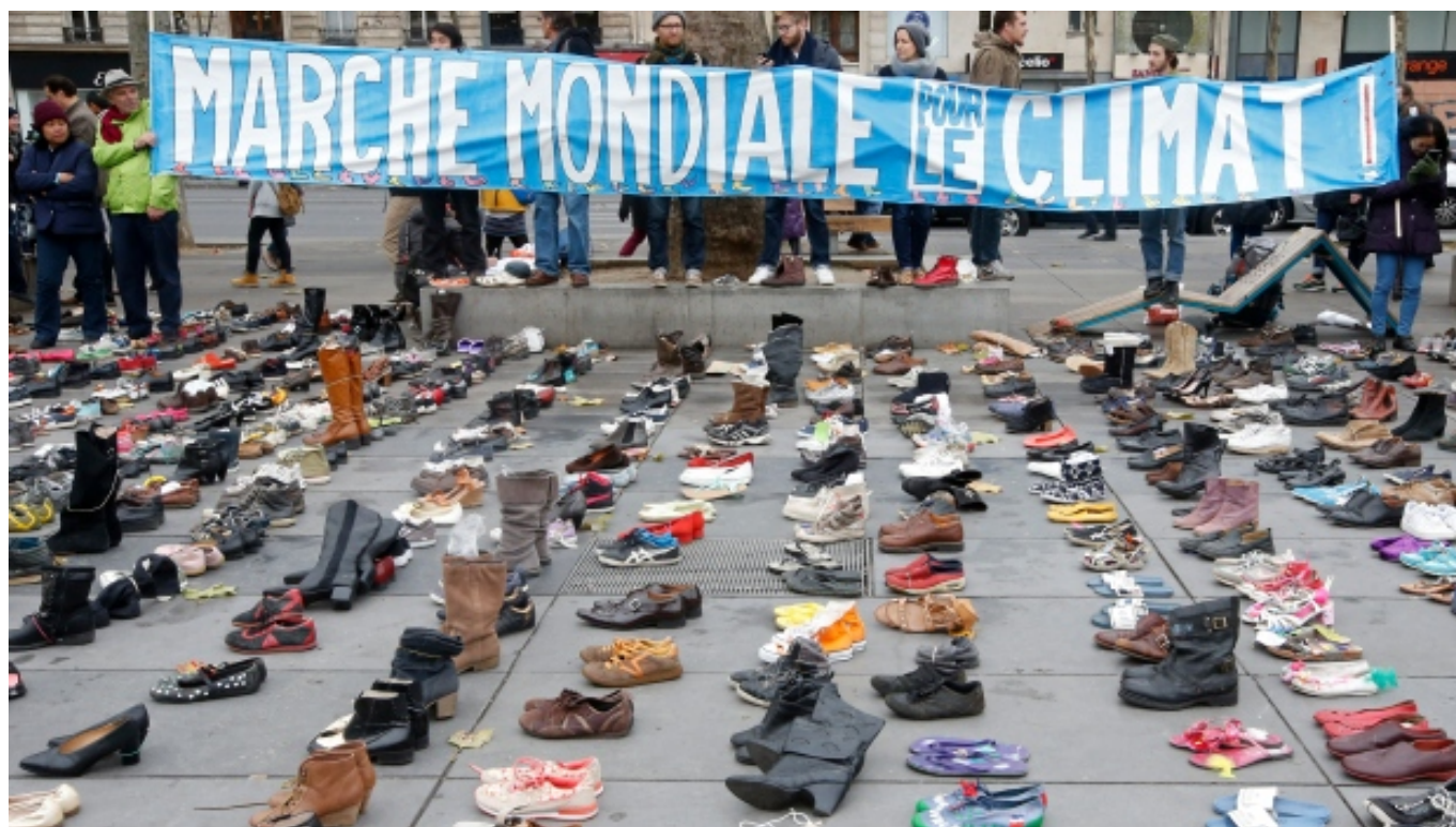
Fabien Bouchard. Climate march silent protest. COP21, Paris 2015.

Podeu consultar aquest llibre [6] al Centre d'Informació i Documentació [7]