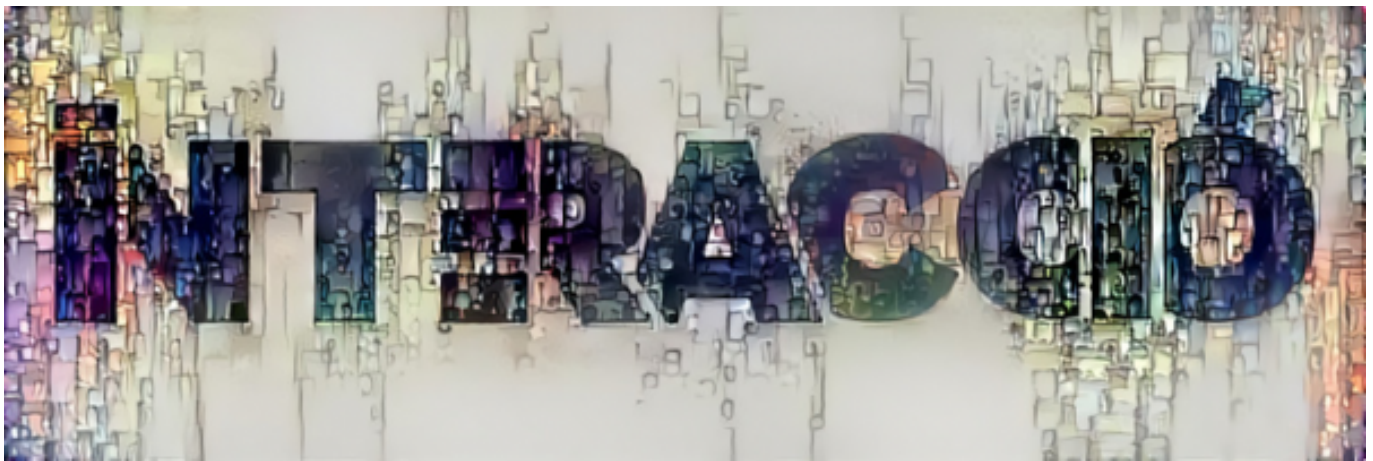
Versió d'Interacció del Deep Dream Generator [32]