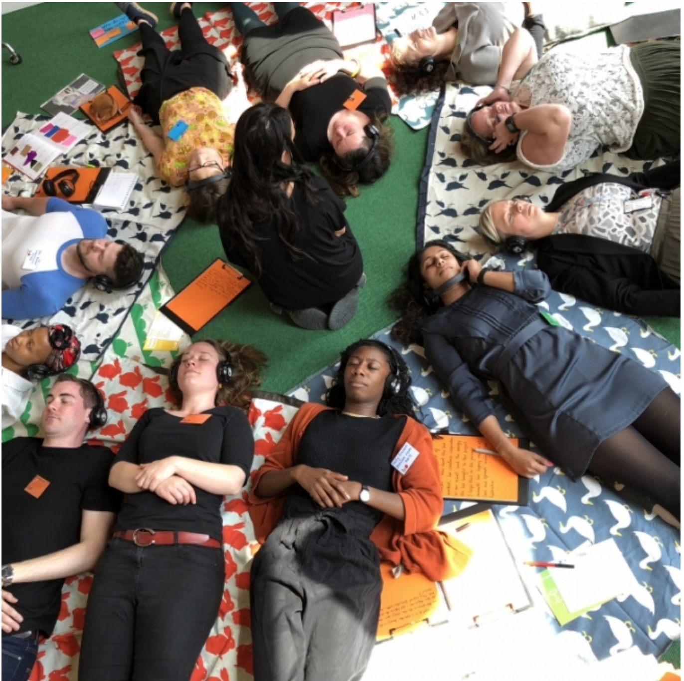
Imatge del web de la plataforma A New Direction [9]