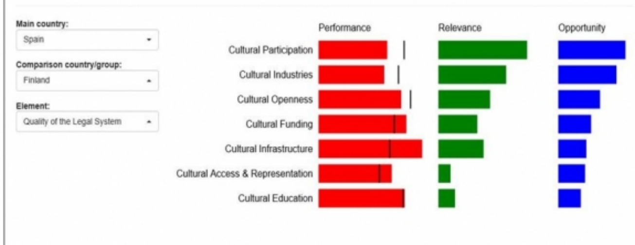
Gràfica 3. Comparativa entre Espanya i Finlàndia pel que fa a la qualitat del sistema legal

Aquestes són algunes de les possibilitats d'anàlisi que ofereix l'IFCD , i que podrien ser eines potencialment útils també per a la recerca social i científica . La voluntat de construir la identitat europea a partir de la cultura, però, a banda de la millora en la configuració de les polítiques culturals, és un dels principals objectiu d'aquesta iniciativa del Consell d'Europa, la qual ens ofereix, sens dubte, perspectives interessants.